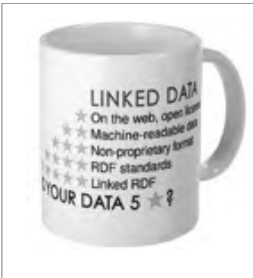
Fig. 5. Le cinque stelle ideate da Tim Berners-Lee per evidenziare la qualità dei linked data.