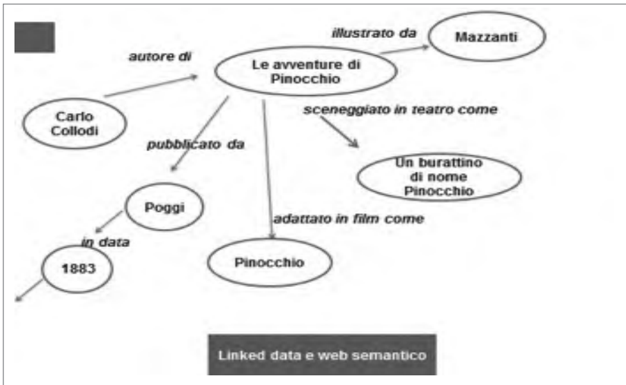
Fig. 4. Modello di uno statement RDF: esempio de Le avventure di Pinocchio .