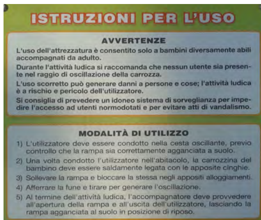
Fig. 7 – Un'attrezzatura 'un tempo' accessibile anche ai bambini su sedia a ruote in un parco urbano.