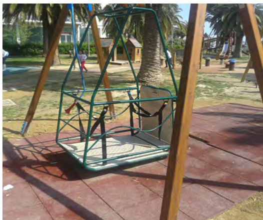
Fig. 6a – Altalena per bambini su sedia a ruote in un parco urbano.