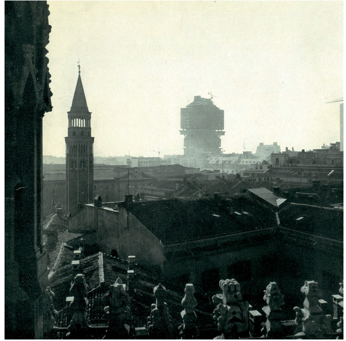
1. Torre Velasca in costruzione, dall'opuscolo pubblicitario della Società Generale Immobiliare, Alinea, Firenze, 1999

posizione di uno spazio inedito, riflettendo su che cosa sia una piazza oggi e che cosa sia casa.