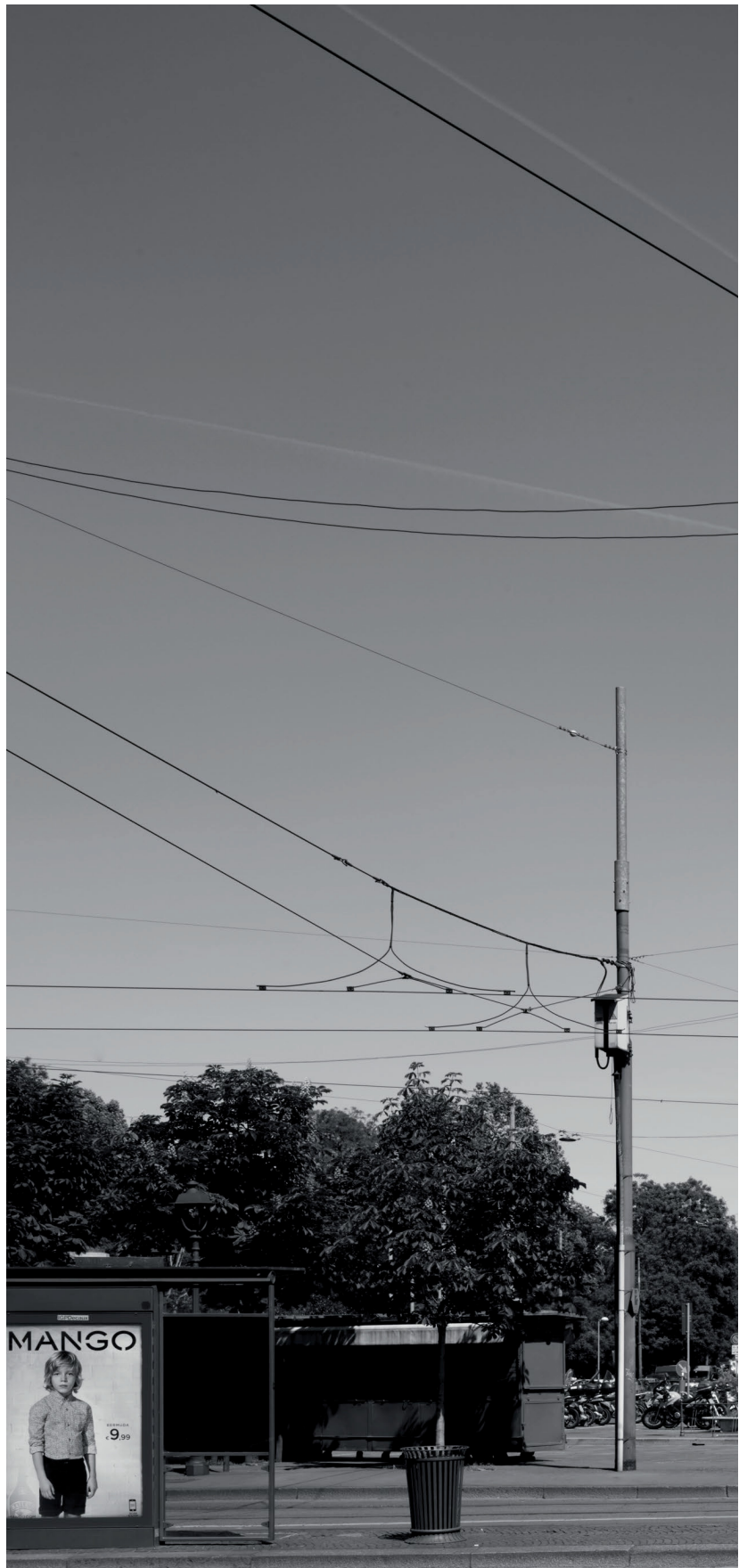
Le fotografie che documentano lo stato attuale dell'edificio e che intercalano i testi sono di Marco Introini