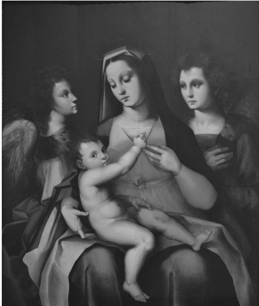
48 - Andrea del Brescianino: 'Madonna col Bambino e due angeli' Anversa, Maagdenhuis Museum