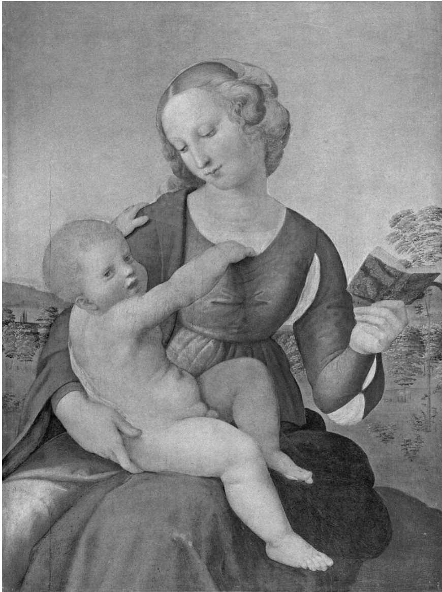
50 - Raffaello: 'Madonna Colonna'

Berlino, Statliche Museen, Gemäldegalerie