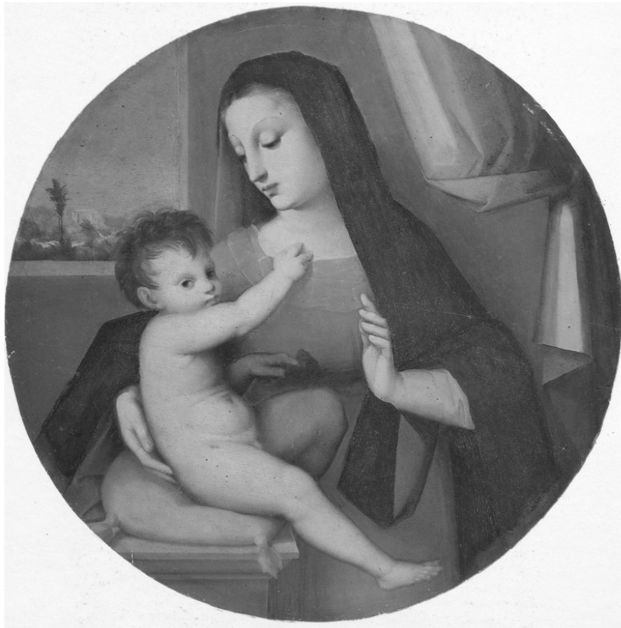
51 - Andrea del Brescianino: 'Madonna col Bambino'