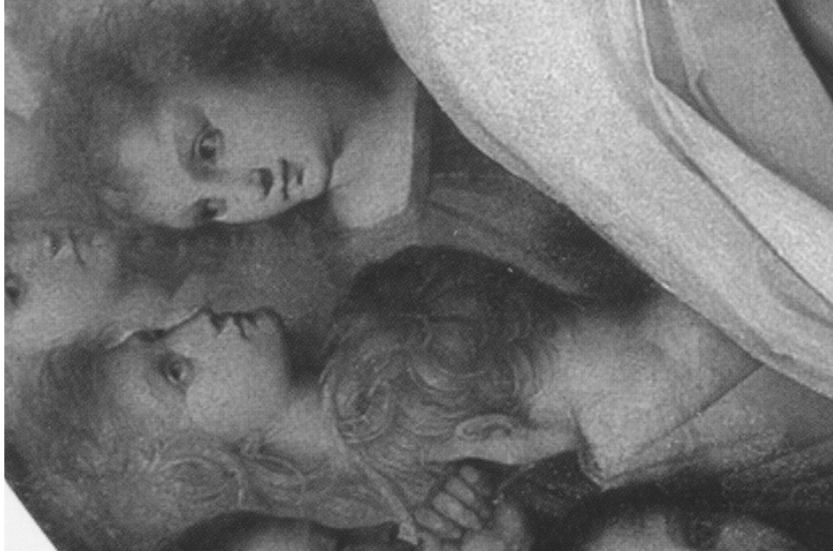
49a - Andrea del Brescianino: 'Incoronazione della Vergine' (part.) Siena, oratorio dei Santi Pietro e Paolo