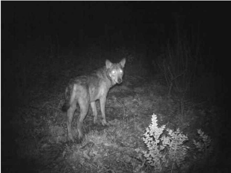
Fig. 4 La diffusione e l'incremento delle popolazioni di ungulati selvatici ha determinato la ricomparsa del lupo su gran parte del territorio regionale

zioni di pregio che richiedono particolari attenzioni e cautele nella gestione dei sistemi produttivi.