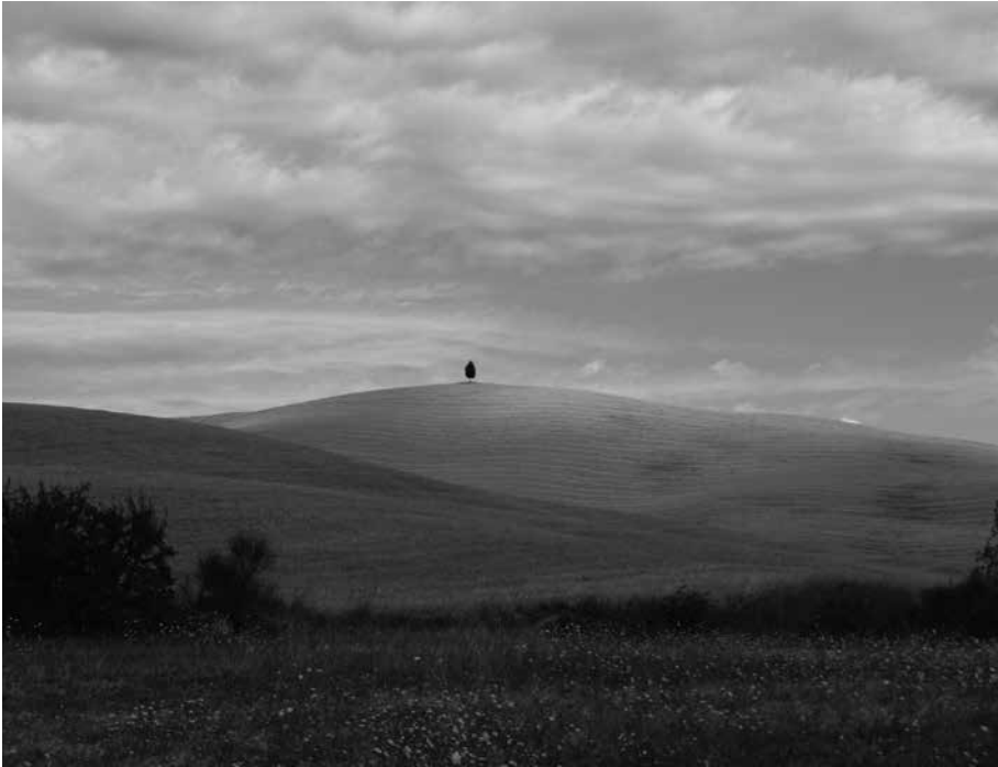
Fig. 2 Un tipico paesaggio agricolo interessato da colture cerealicole in Val d'Orcia

(anche di piccole dimensioni), le aree ecotonali, i prati e pascoli cacuminali, ecc.; in poche parole hanno definito i caratteri propri di una rilevante monotonìa ambientale caratterizzata, spesso, da un grave decadimento in termini di biodiversità.