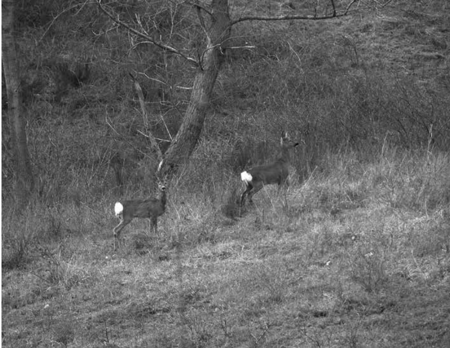
Fig. 3 Il capriolo è una delle specie che ha subito la maggiore espansione negli ultimi anni (F. Sorbetti Guerri)

economiche e agli animali per mantenere popolazioni vitali (Banti et al., 2009).