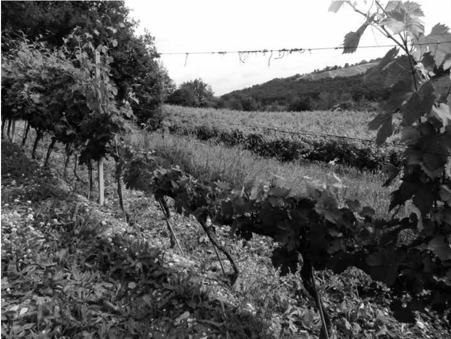
Fig. 6 Danni primaverili da brucamento in un vigneto del Chianti. Il trappolaggio video fotografico ha consentito di documentare il persistente danneggiamento di ben definite porzioni di filare da parte del capriolo con gravi danneggiamenti delle piante (da videoripresa GESAAF)

solo e non tanto alla carenza di alimenti presenti nell'area quanto, piuttosto, al particolare richiamo esercitato nei confronti dei selvatici, nei diversi periodi dell'anno, da fonti trofiche particolarmente appetite come possono essere certe colture agrarie. È in tali situazioni che metodi di prevenzione indiretta come le colture a finalità faunistica, allestite non in modo generico ma realizzate con specie vegetali in grado di esercitare un'attrazione che si equivalga o superi quella delle colture da proteggere, potrebbero fornire un valido contributo alla mitigazione del problema.