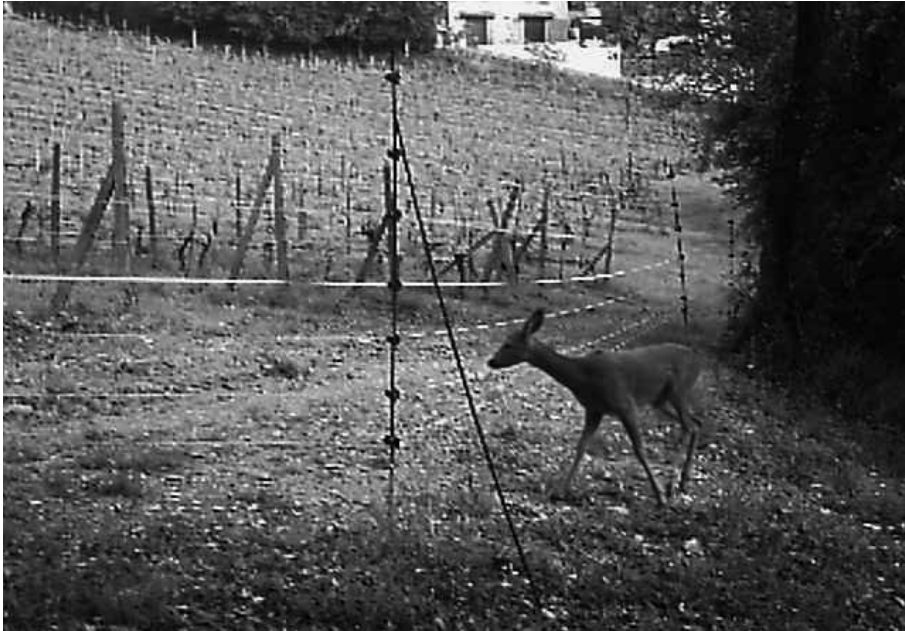
Fig. 5 La notevole quantità di ungulati presenti sul territorio regionale richiede l'adozione di misure di protezione delle colture specifiche per le diverse specie animali

I diversi metodi di prevenzione possono essere infatti classificati in due grandi gruppi: