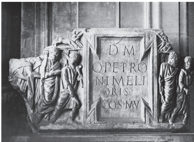
Fig. 5. Coperchio mutilo di sarcofago in marmo (240/245 d.C.). Parigi, Museo del Louvre, magazzini, MA 1466 (rielaborazione da LIU 1969, pl. 15).

turalis Historia 54 , nei paragrafi che espongono la teoria della riproduzione e della sterilità, fra le famiglie numerose trova anche spazio nella casistica elencata il riferimento a un cittadino di origine fiesolana, C. Crispinius Hilarus, ex ingenua plebe Faesulana , altrimenti ignoto, che si reca a Roma dall'imperatore Augusto per offrire un sacrificio in Campidoglio, accompagnato da un largo seguito di figli, nipoti e pronipoti, per un totale di 61 persone! Sul personaggio non abbiamo riscontri onomastici e un cerimoniale connesso a questo tipo di processione non è altrimenti menzionato. Mi pare plausibile che questo evento memorabile possa collegarsi a forme di onorificenze riconosciute e registrate negli acta publica 55 ai capostipiti di famiglie numerose, sullo sfondo della normativa augustea che a partire dalla lex de maritandis ordinibus del 18 a.C. approvava e incentivava la natalità.