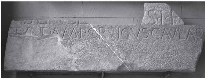
Fig. 3. Lastra in pietra serena, frammentaria (30 a.C./100 d.C.). Fiesole, Museo Civico Archeologico, portico d'ingresso del Museo.

È certo che la nuova colonia con il nome augurale di Florentia poté favorire la rivalorizzazione del territorio, ponendosi come polo di attrazione anche politico 26 . Fra la fine del I sec. a.C. e la prima metà del I sec. d.C. è necessario però prendere atto che il paesaggio urbano di Fiesole viene potenziato. La superficie della città è calcolata intorno a 29 ettari, di grandezza superiore rispetto a Florentia 27 . Viene edificato un teatro con una capacità di tremila posti, un nuovo tempio sopra quello etrusco, un complesso termale, che in epoca adrianea verrà restaurato e ampliato con vari ambienti, tra cui si segnala la realizzazione di una palestra, del tutto inusuale in Italia e secondo uno schema architettonico che ritroviamo solo in Etruria meridionale, nel contemporaneo esempio di Ferentium 28 . Un'iscrizione in pietra serena ricorda il rifacimento del tempio e l'erezione di un portico, la cui esistenza è confermata dall'evidenza archeologica (Fig. 3) 29 . I due personaggi che