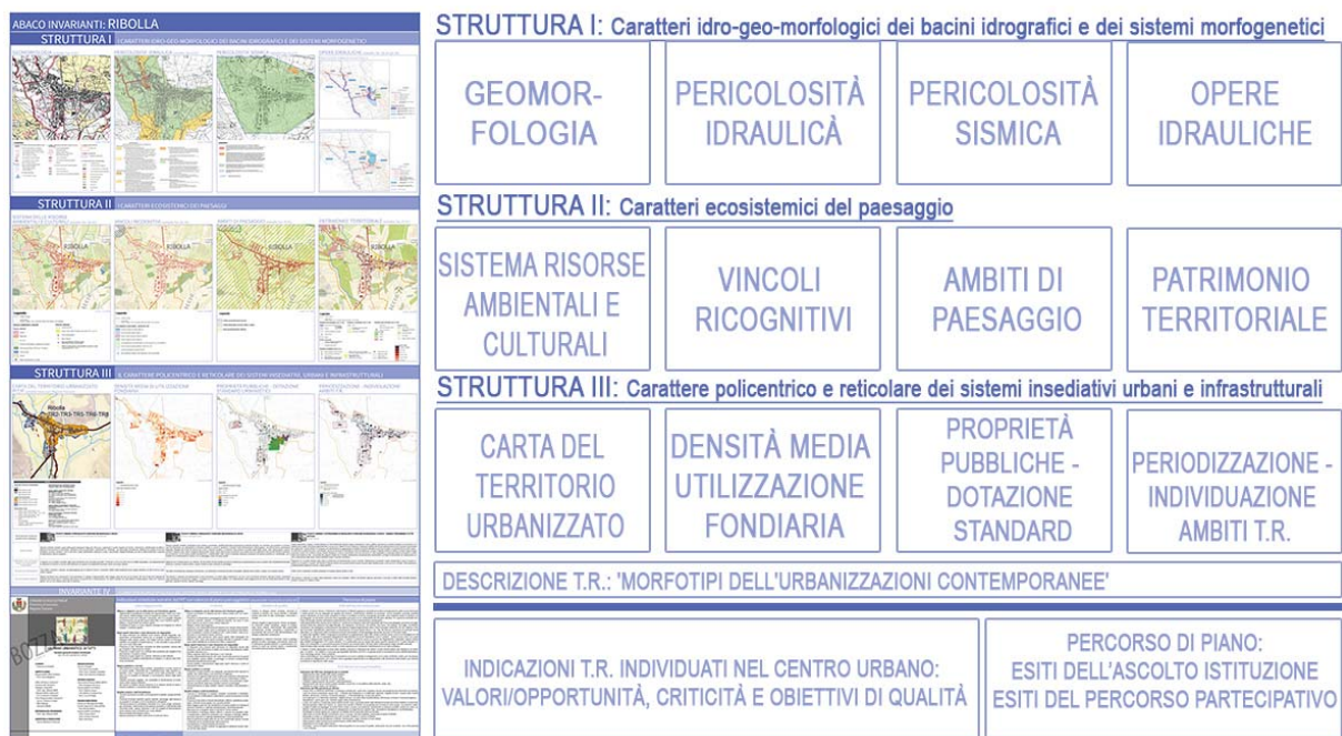
Figura 1 | Schema d'impostazione dell'abaco.

L'idea di ridurre all'essenziale la documentazione del piano, quindi, non è da intendersi come una riduzione di lettura della complessità del territorio, ma al contrario come una rappresentazione chiara e facilmente trasmissibile della sua complessità. Se la volontà è il raggiungimento degli obiettivi sopracitati, gli strumenti urbanistici non possono che essere restituiti nel modo più chiaro e immediato alla lettura, per dare cittadinanza 'di pianificazione' a tutti.