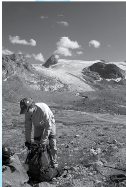
Preparandosi sotto il ghiacciaio del Rutor, 2009

invero non eccelsa, le quali legano il loro nome a exploit di conquista notevoli per l'epoca, insieme ai loro clienti, definendo la relazione in forma più paritaria, almeno sul piano della competenza tecnica se non ancora della dimensione sociale 24 . Alla fine dell'Ottocento e all'inizio del Novecento, lo sviluppo di una gerarchia (attraverso i diversi inquadramenti di livello per le guide alpine fino alla distinzione nei confronti della minorità professionale dei portatori e mulattieri) 25 , segnala in chiave evolutiva una differenziazione in termini di abilità legate alla trasformazione tecnica e tecnologica della pratica, alla luce della sua ormai evidente sportivizzazione: un indicatore dei possibili processi di crescente professionalizzazione nelle attività legate al loisir in montagna, determinati dalla centralità della prestazione che lo stava investendo sia fra le guide sia fra i praticanti dilettanti. Un fenomeno di specializzazione che oggi, anche grazie al contributo dell'alpinismo dei paesi sviluppati, ambigualmente sospeso fra promozione e utilitarismo, ritroviamo pure fuori dell'Europa e del Nord America, seppur con modalità e in contesti profondamente diversi.