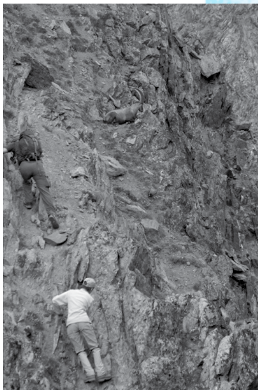
Sulle rocce vicino ad uno stambecco, 2009

Non a caso una delle prime forme di confronto fra guide e clienti è stato proprio il tentativo da parte dei club alpini, cioè le organizzazioni dei praticanti e dei potenziali mandanti, di normare e regolare tariffe e modalità dei servizi dei mandatari, andando contro forme monopolistiche di tipo corporativo, molto differenziate geograficamente, quali quelle tentate fin dagli anni venti dell'Ottocento dalle prime compagnie valligiane di guide alpine. In Italia, per esempio, la promozione da parte del Cai del Consorzio delle guide alpine delle Alpi occidentali nel 1888 e poi delle Alpi centrali e orientali nel 1895 andava in questa direzione. Questi consorzi regionali sarebbero stati poi unificati dal