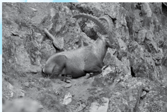
Maschio di stambecco in Val di Rhemes, 2009

so alle guide professionali in quanto esse traggono profitto dalla loro pratica, anche se poi molti degli alpinisti che ne sono gli attuali membri – grazie alle sponsorizzazioni – hanno un profilo da sportivi professionisti e tanti sono diventati pure guide, magari rinunciando al titolo accademico, per poter avere l'opportunità economica di continuare l'alpinismo esplorativo e di ricerca 8 . Si dedicano cioè a quella che un grande alpinista francese del secondo dopoguerra, Lionel Terray, diventato guida per le medesime prosaiche ragioni, definiva «una specie di prostituzione onorevole», confermando quindi la distanza fra i modelli ideali dell'alpinismo come loisir e la sua commercializzazione turistica come professione 9 .