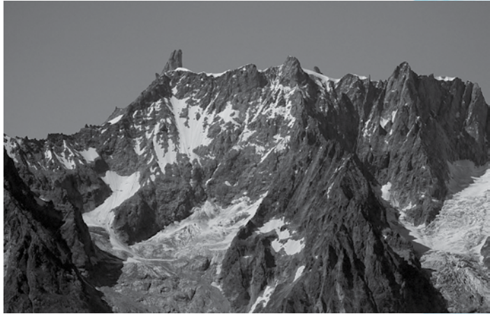
Dente del Gigante - Gruppo del monte Bianco, 2009

sato anche se non con questa virulenza 3 , si ripropongono oggi altrove, quando certi modelli di consumo e di normalizzazione turistica dell'alpinismo si vanno affermando molto rapidamente in contesti diversi da quelli che l'hanno visto nascere e diffondere fra Ottocento e Novecento, assai più lentamente,