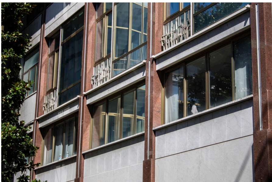
4. Carlo Aymonino, Camera di Commercio, Industria e Agricoltura di Carrara, fronte verso il giardino, particolare.