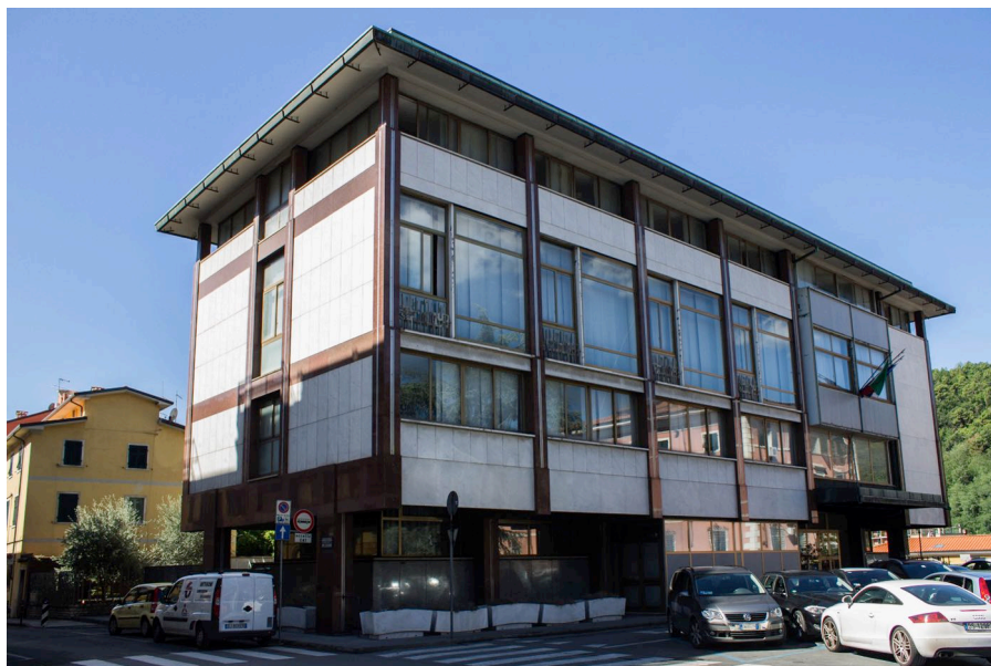
1. Carlo Aymonino, Camera di Commercio, Industria e Agricoltura di Carrara, fronte verso via Massimo d'Azeglio.