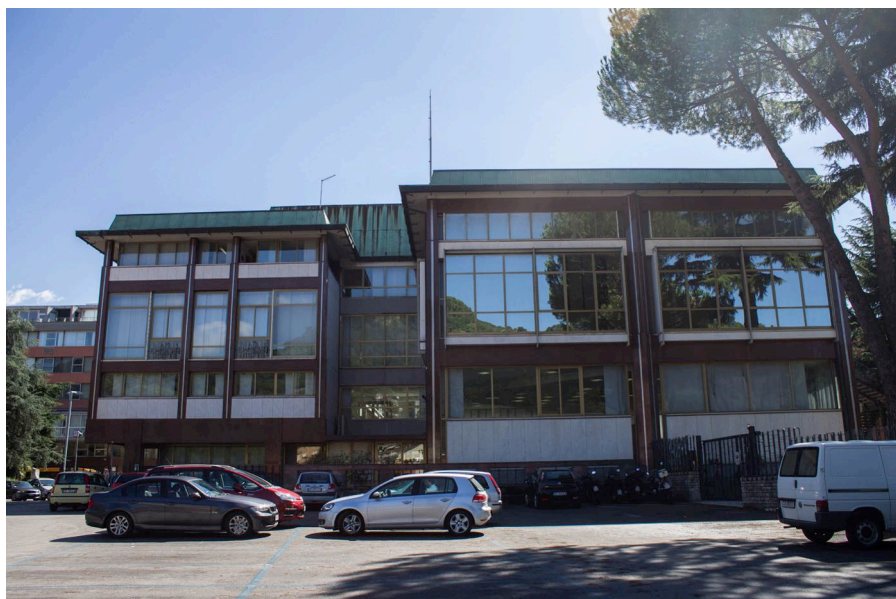
2. Carlo Aymonino, Camera di Commercio, Industria e Agricoltura di Carrara, fronte verso nord-ovest.