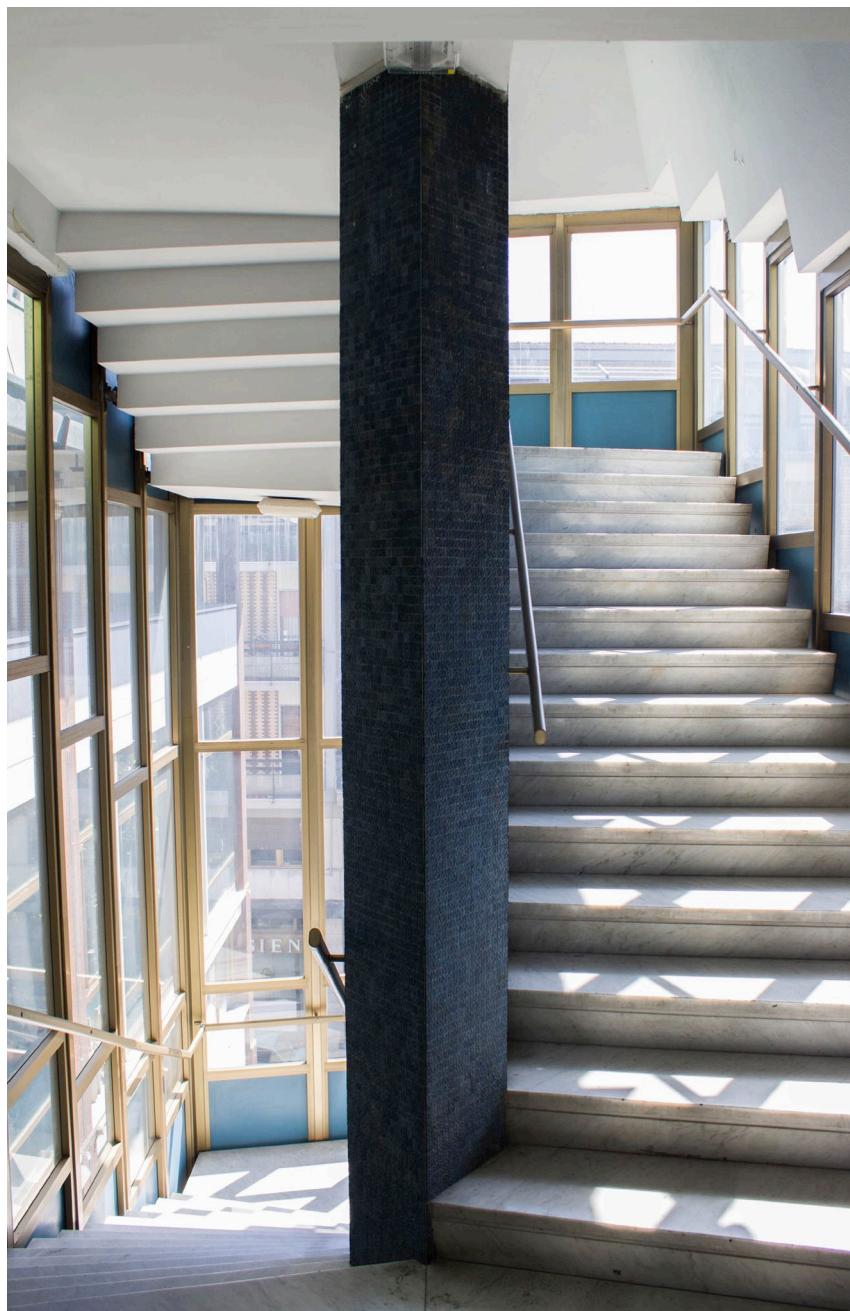
6. Carlo Aymonino, Camera di Commercio, Industria e Agricoltura di Carrara, scala secondaria, vista interna.