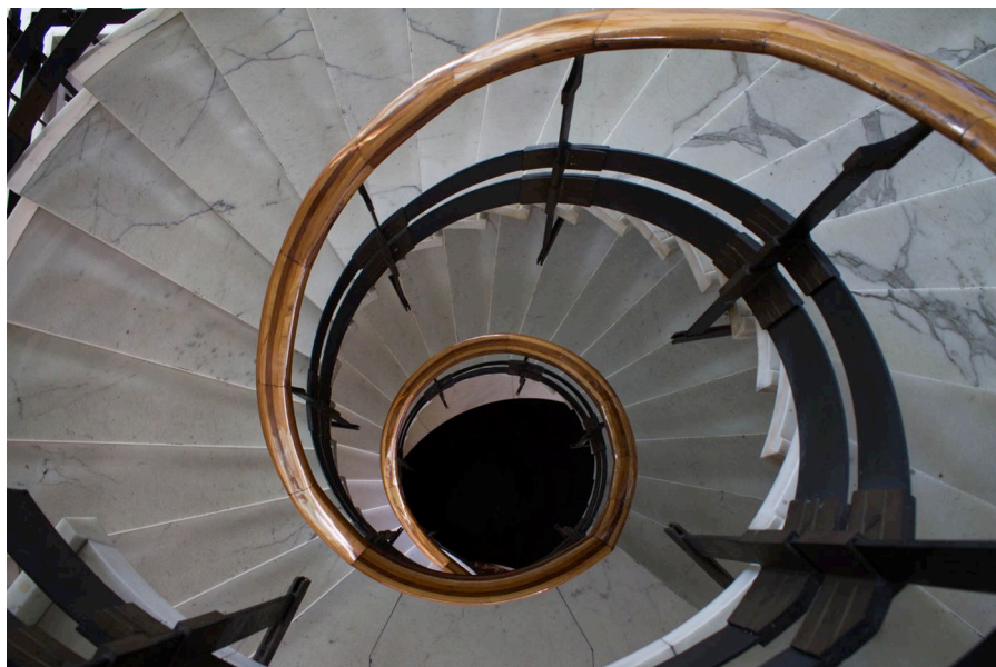
9. Carlo Aymonino, Camera di Commercio, Industria e Agricoltura di Carrara, scala principale, dettaglio.