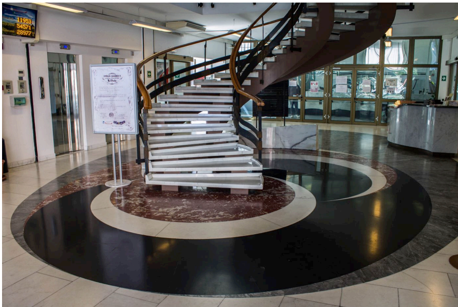
7. Carlo Aymonino, Camera di Commercio, Industria e Agricoltura di Carrara, scala principale nella hall d'ingresso con il disegno in marmi policromi del pavimento (foto dell'autore).