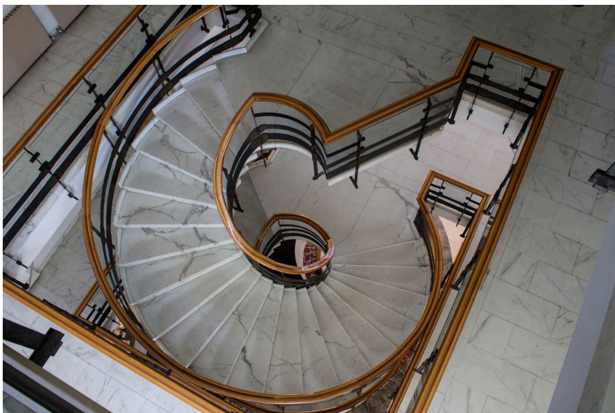
8. Carlo Aymonino, Camera di Commercio, Industria e Agricoltura di Carrara, scala principale.