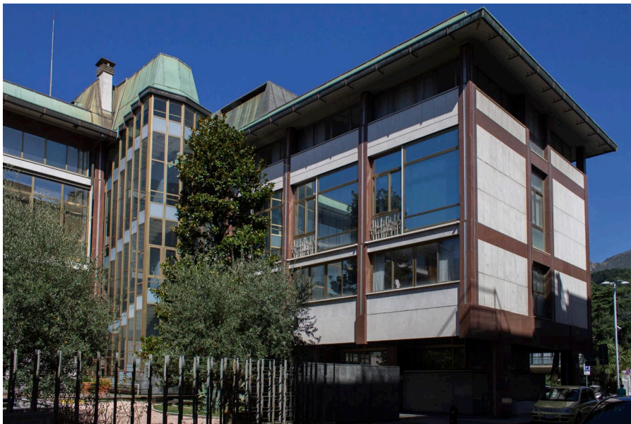
3. Carlo Aymonino, Camera di Commercio, Industria e Agricoltura di Carrara, i due corpi e il volume vetrato della scala secondaria, vista da via VII Luglio.