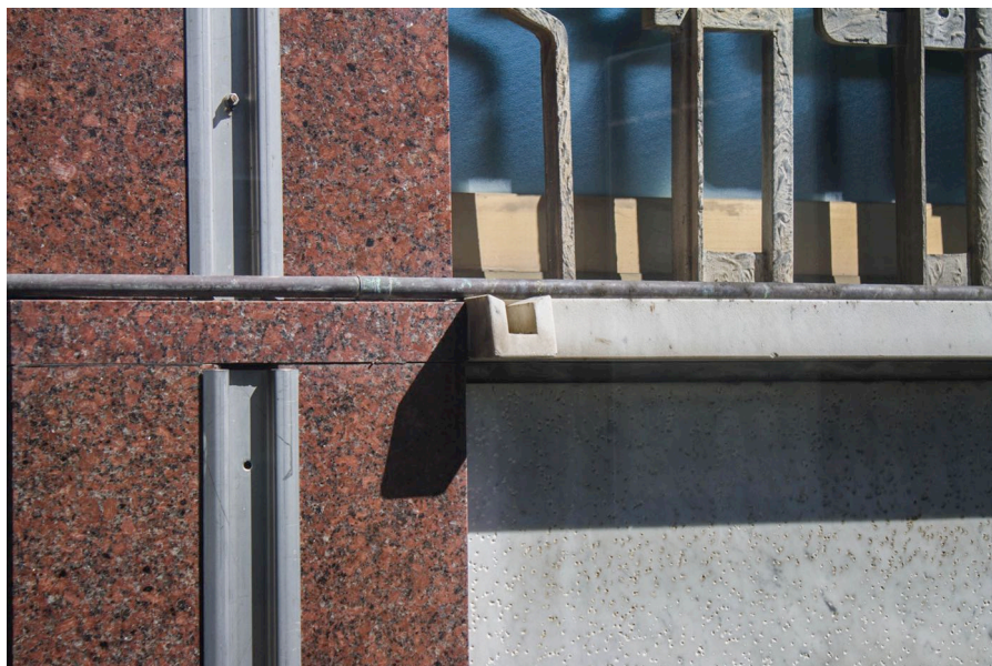
5. Carlo Aymonino, Camera di Commercio, Industria e Agricoltura di Carrara, fronte verso il giardino, particolare (foto dell'autore).