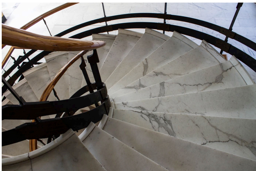
10. Carlo Aymonino, Camera di Commercio, Industria e Agricoltura di Carrara, scala principale, dettaglio.