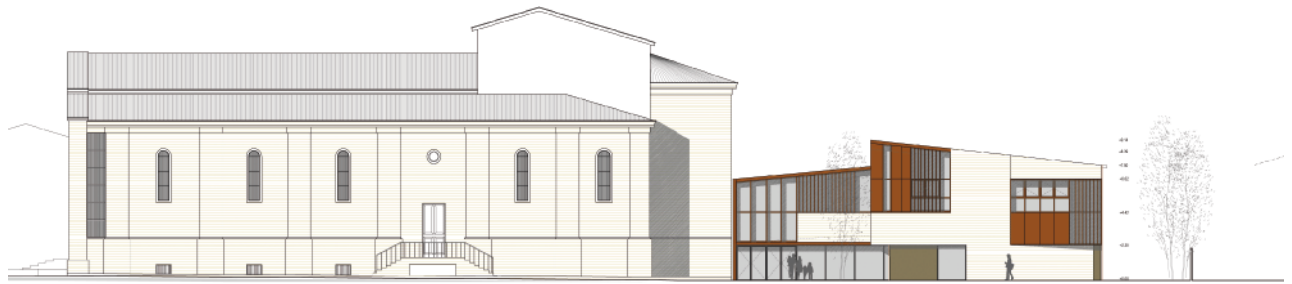
Prospetto est East elevation