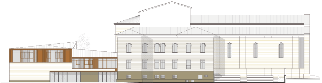
Prospetto ovest West elevation