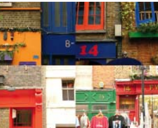
Collage di fotografie dei portoni colorati di Londra: immagine reference per il progetto di Central St. Giles Collage of photos of London coloured front doors: reference image for Central St. Giles project