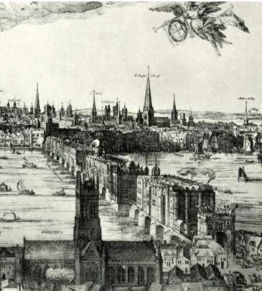
Dettaglio della vista di Londra incisa da Claes van Visscher nel 1616: immagine reference per il progetto della Shard Detail of the London view carved by Claes van Visscher in 1616: reference image for the Shard project