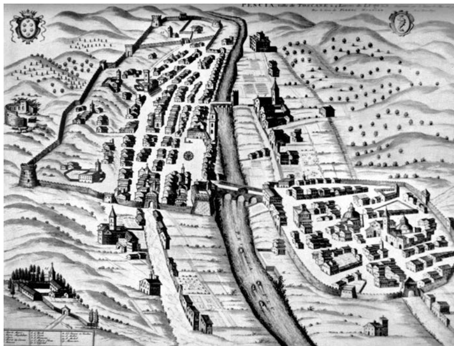
Pianta di Pescia [1712, Pierre Mortier, Museo civico di Pescia]. Le due cerchie di mura, corredate da torri e porte, sono rappresentate ancora intatte, nonostante nel XVIII secolo fosse già abbondantemente diffusa la pratica della costruzione in aderenza al sistema difensivo e parte della cortina fosse andata distrutta.

Il successivo sviluppo del tessuto edilizio venne fortemente condizionato dalle caratteristiche morfologiche e idrografiche del territorio e dalla presenza, in posizione intermedia tra il torrente e la chiesa dei Santi Stefano e Niccolao, di un'area inizialmente libera (forse una zona di colmata?) destinata a partire dal XI secolo agli scambi commerciali (dal 1068 conosciuta come mercato