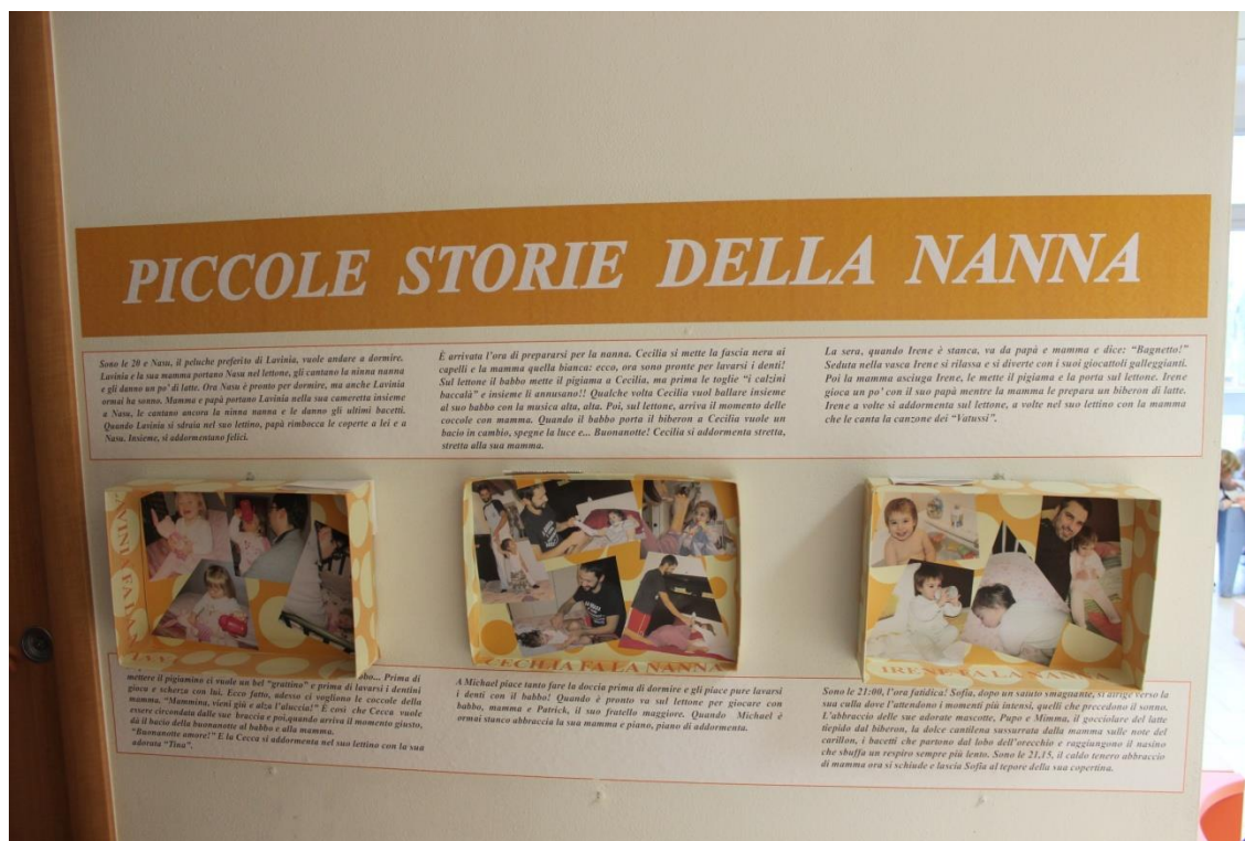
Figura 3: Documentação Piccole Storie della Nanna – Nido Il Grillo

Na construção da documentação “Piccole Storie della Nanna”, os familiares são convidados a registrar, por meio de uma pequena história, os rituais cotidianos em que a criança adormece. As crianças levam para casa um pequeno bloco e uma caixa para registrar por escrito e com fotografias suas histórias junto à família. A professora acolhe as histórias contadas pelas famílias e paralelamente, observa, registra e documenta também histórias de repouso na creche. Esses momentos significativos, posteriormente são compartilhados.