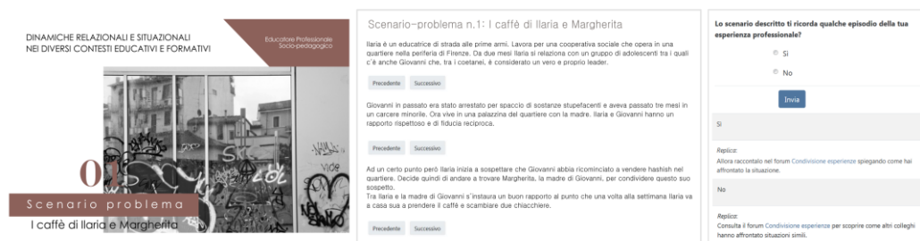
Figura 7. Posizione del problema e attivazione con condivisione di esperienze online.