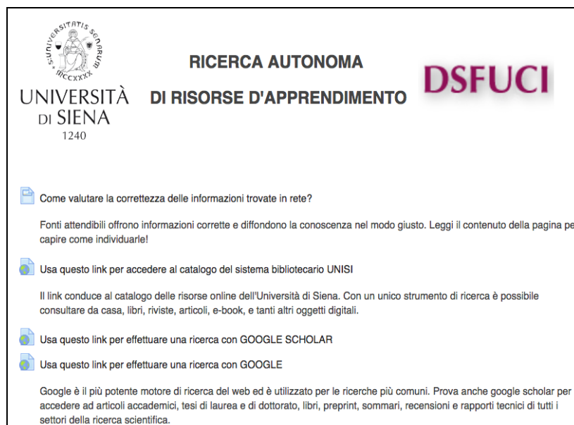
Figura 10. Una sezione della piattaforma Moodle per la ricerca autonoma di risorse.