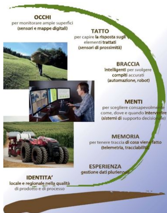
Figura 1 – Identificazione delle tecnologie abilitanti nello Smart Farming

I sistemi tecnologici per essere proficui devono trovare un loro preciso ambito applicativo. La Toscana in tal senso ha promosso la High Tech Farming Platform nell'ambito dell' Agrofood Smart Specialization Strategies ( European Commission, 2018 ) evidenziando come le nuove tecnologie di Digitalizzazione e Smart Specialization devono essere identificate in cluster di strumenti abilitanti come evidenziato nella figura 1.