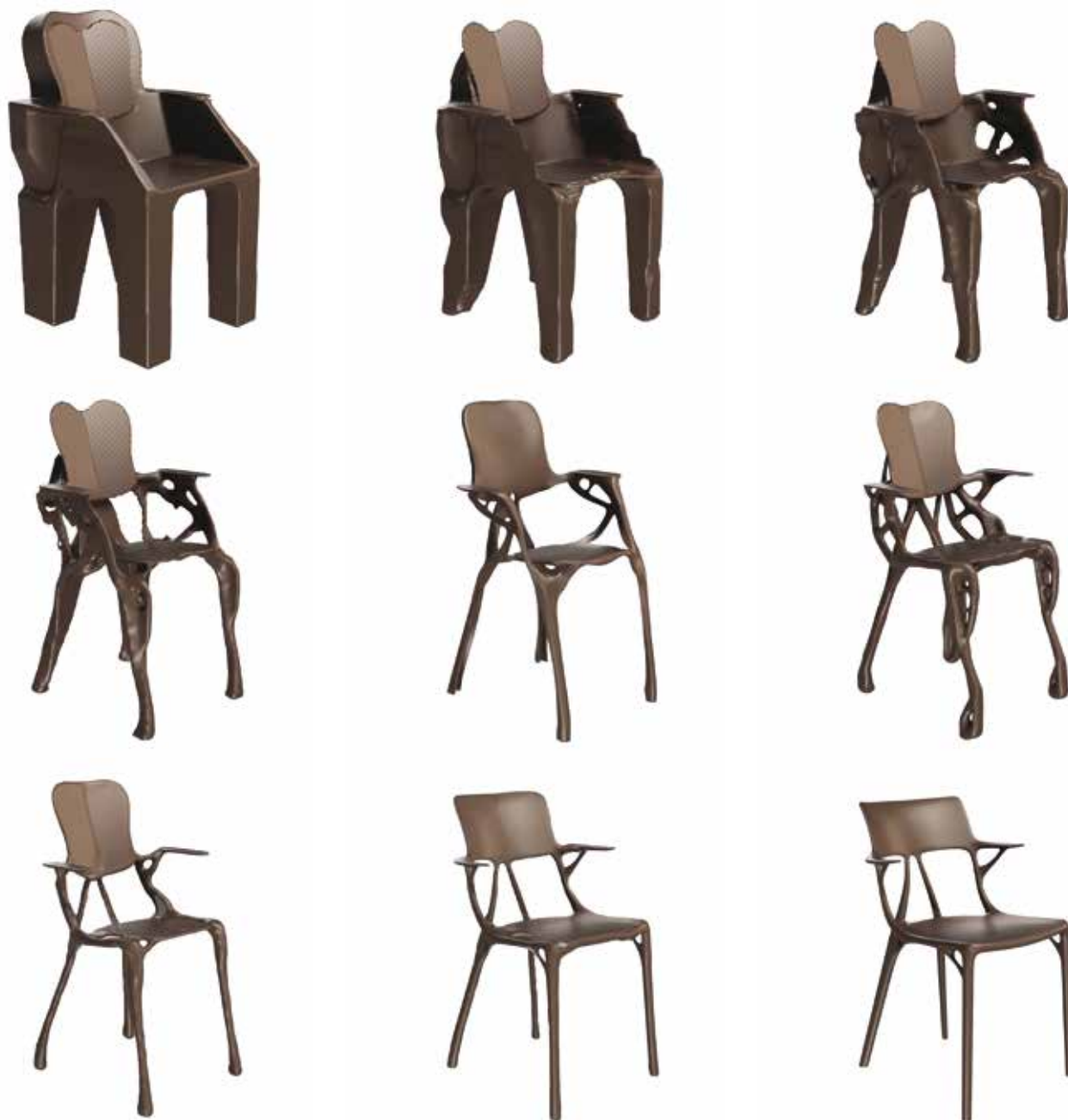
in alto / above: costruzione generativa attraverso il software / generative construction by software