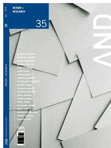
in copertina/cover: Carta bianca sparsa / Scattered white paper

AND rispetta l'ambiente stampando su carta FSC