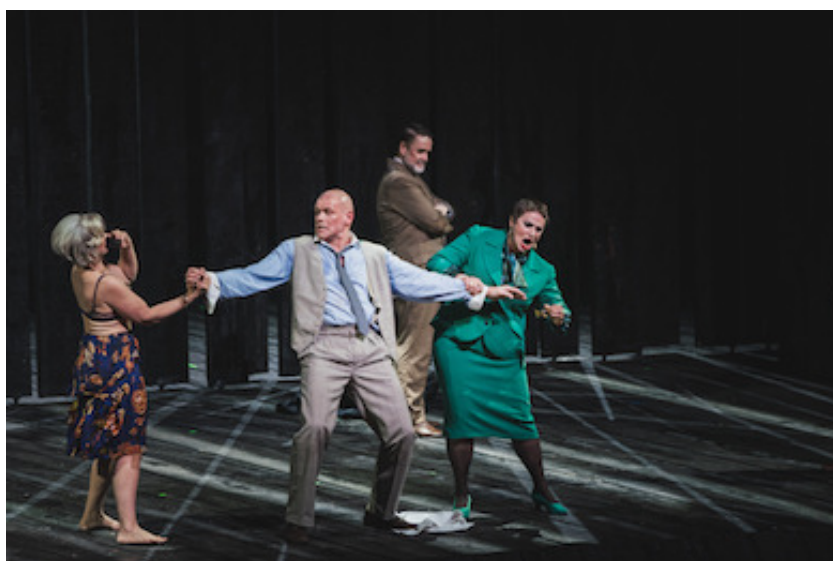
Un momento dello spettacolo