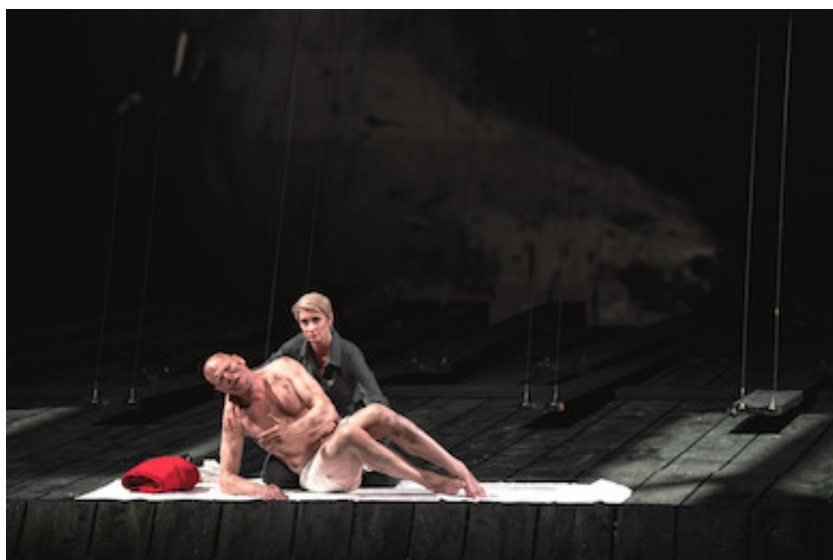
Un momento dello spettacolo