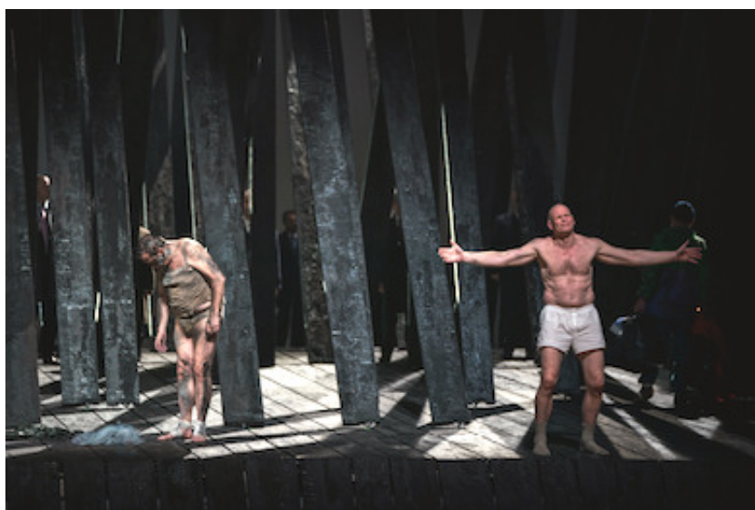
Un momento dello spettacolo

L'allestimento di Bieto, andato in scena all'Opéra di Parigi lo scorso 2016 e qui ripreso da Yves Renoir , esplora i temi del potere e dell'amore distorto con azioni tanto semplici quanto di impatto. Appena entrato in scena Lear spezza il pane, simbolo del suo regno in terra, e lo dà alle figlie Goneril e Regan, che lo addentano come cani al tavolo di un padrone segretamente odiato. Ulteriori riferimenti cristologici percorrono l'intero spettacolo: a turno, ciascun personaggio si sveste e/o raccoglie le vesti degli altri per spartirselo. All'inizio della seconda parte Cordelia sgorga sangue dalle mani, novello agnello venuto a togliere i peccati del mondo, destinato a fallire. Per il resto, nonostante Reimann e il suo librettista Claus Henneberg non abbiano espunto le scene più crude (come intendeva fare Verdi nel suo incompiuto progetto), gesti esplicitamente violenti non ce ne sono. Bieto decide di lasciarli alla partitura e lavora invece per saturazione, contraendo l'infinitamente grande delle folli passioni in gesti minimi, rarefatti. In ciò lo aiutano i costumi da borghesia senza tempo ideati da Ingo Krügler , le luci stranianti di Franck Evin e, soprattutto, le scene di Rebecca Ringst . Quest'ultima costruisce un meccanismo da orologiaio: una parete lunga quanto il palco, formata da assi verticali mobili che, abbassandosi progressivamente, si dischiudono per diventare prima foresta e poi scogliera, fino a crollare nel finale assieme alla casa di Lear.