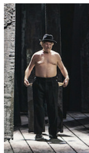
Un momento dello spettacolo visto l'8 maggio 2019 al Teatro del Maggio di Firenze