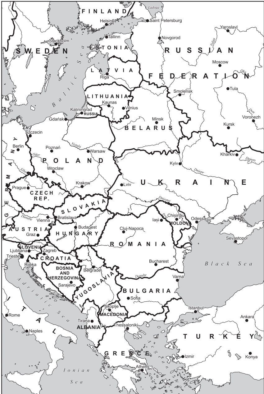
Harta 5.1. Europa de Est, 1995. Hartă realizată de către Béla Nagy, Academia Maghiară de Științe.