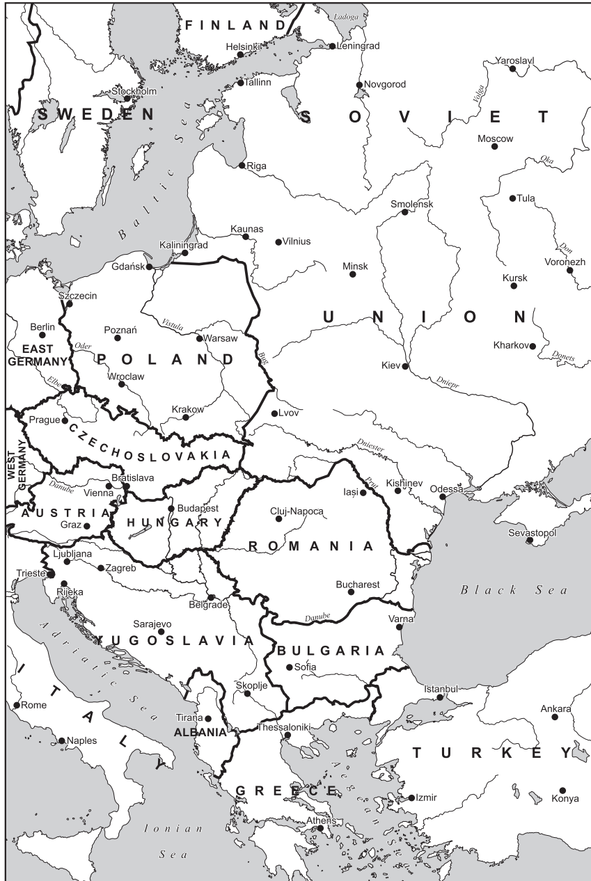
Harta 1.3. Europa de Est în anul 1949. Hartă de Béla Nagy, Academia Maghiară de Științe.