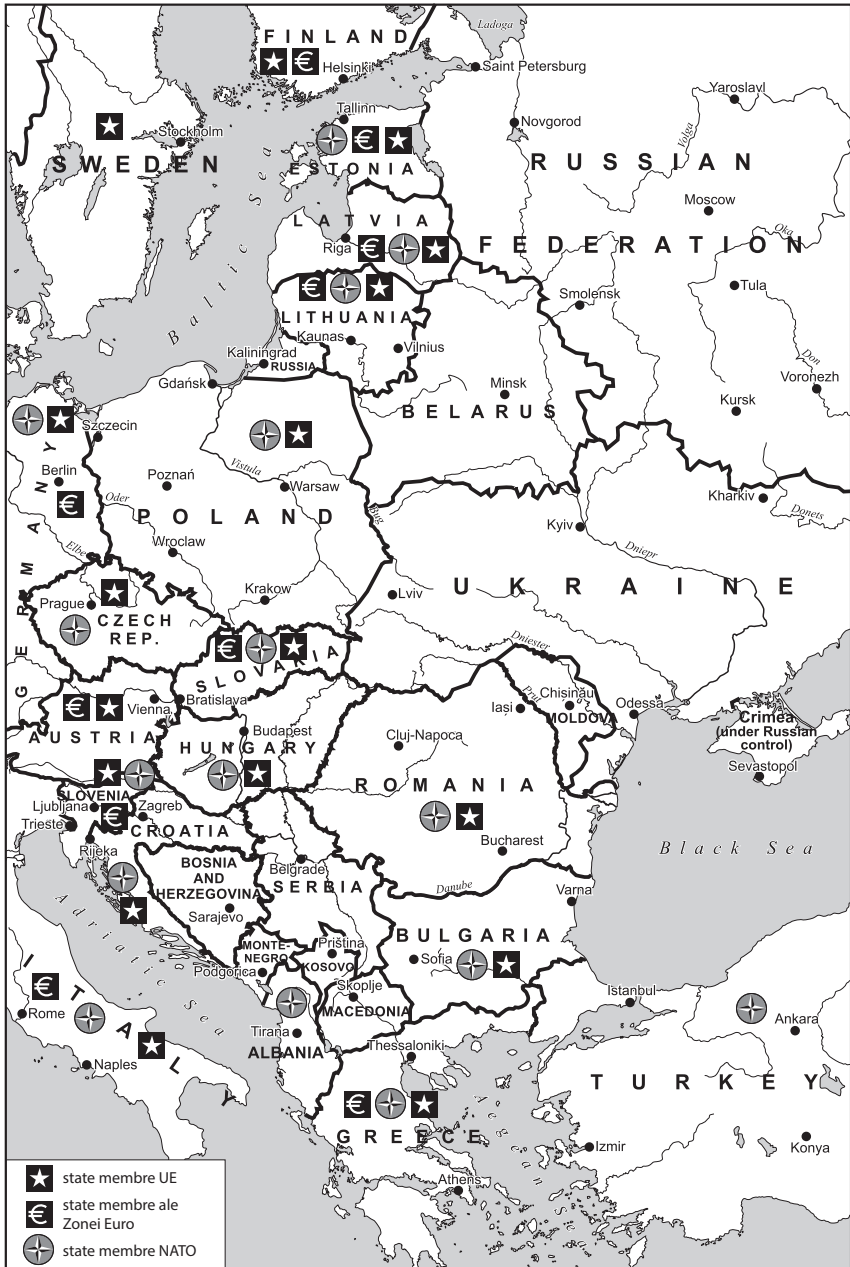
Harta 6.1. Europa de Est, 2016. Hartă realizată de către Béla Nagy, de la Academia Maghiară de Științe.