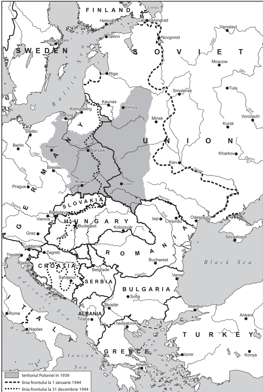
Harta 1.1. Europa de Est, 1944. Hartă de Béla Nagy, Academia Maghiară de Științe.