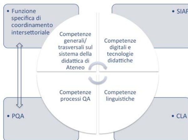
Figura 2 – Azioni formative e strutture di riferimento

Nei Rapporti relativi al 2018 e al 2020 del Nucleo di Valutazione su “Sistema di Qualità dell’Ateneo e dei Corsi di Studio” le iniziative di formazione sono state, inoltre, menzionate e riconosciute tra le azioni volte a favorire la qualità e l’innovazione della didattica.