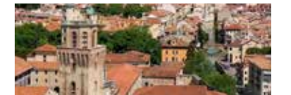
PADOVA: LABORATORIO DI RESILIENZA