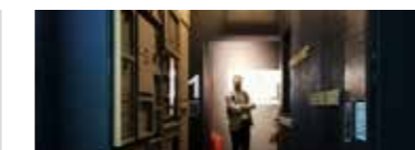
LIVING [THE INVISIBLE] SPHERE