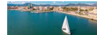
COMUNE DI OLBIA: CITTÀ SOLIDALE SOSTENIBILE SICURA