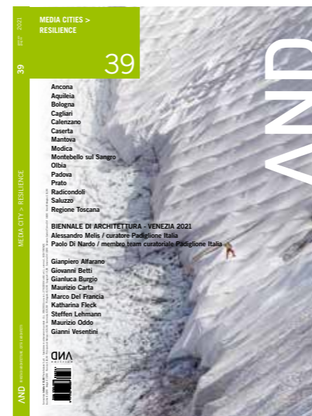
in copertina/cover: Il ghiacciaio Presena coperto dai teli geotessili / The Presena glacier covered by geotextiles

La rivista non è responsabile per il materiale inviato non richiesto espressamente dalla redazione. Il materiale inviato, salvo diverso accordo, non verrà restituito.