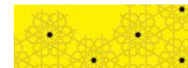
LA CITTÀ LABORATORIO