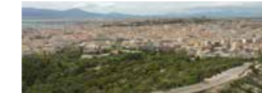
UNA CITTÀ SULL'ACQUA