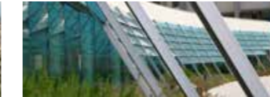
CALENZANO CITTÀ FUTURA