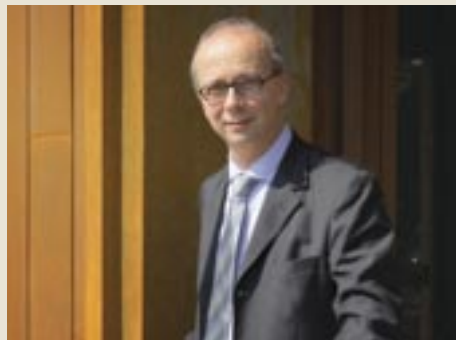
Progetto: Prof. Arch. Fabrizio Rossi Prodi

del guardaroba, del Sacratio per la dispersione delle particole nella terra; In aderenza al locale sacrestia, disimpegnato dallo stesso corridoio, l'ufficio parrocchiale dotato di archivio ed un servizio. A seguire, l'atrio di ingresso ai locali parrocchiali (con accesso anche da via Gorizia) che smista il salone dotato di guardaroba, 4 aule per il catechismo ed i servizi. Al piano primo, in aderenza all'aula liturgica e dotata di propria scala privata, la casa canonica composta da soggiorno/cucina, due camere, due servizi, un ripostiglio ed una terrazza: è accessibile anche dalla parte opposta sfruttando l'ascensore parrocchiale. All'altra estremità, i servizi, un'aula catechismo ed una sala riunioni dotate di ampia terrazza. Le attività rumorose (aule, salone, locali tecnici) sono separate da quelle necessitanti di quiete: un atrio passante, a tutta altezza, segna la cesura fra le due zone a rumorosità differenziata.