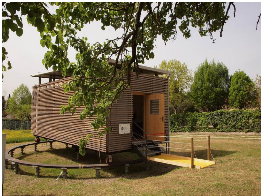
Fig.1 La Test Cell del laboratorio TAM