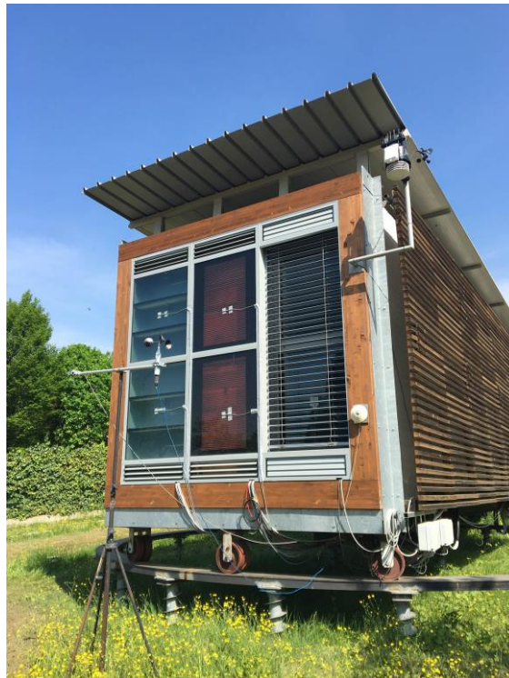
Fig.3 Il prototipo SELFIE montata sulla Test Cell con i sensori del monitoraggio in regime dinamico

suo comportamento dinamico, il prototipo di facciata SELFIE, è stato testato utilizzando una struttura di prova all'aperto in dotazione al laboratorio TAM 11 ; una cella di prova esterna (del tipo PASSLINK) in grado di valutare le prestazioni energetiche di sistemi di facciata a scala reale attraverso un ambiente ben controllato e realistico di dimensioni di una stanza, dotato di strumenti di misura avanzati che forniscono un'elevata qualità dei dati di output provenienti dal test di monitoraggio dinamico.