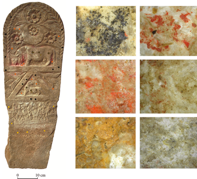
Fig. 52 : Stèle avec points d'observation au Dino-lite (à gauche) et micrographies de traces de peintures observées (à droite) (120x).

Pareillement, si l'on sait déjà que les statues romaines de la Proconsulaire étaient peintes et des exemples spectaculaires sont conservés dans les collections du Musée national du Bardo 205 à Tunis, le corpus statuaire de la ville de Dougga complète l'enquête sur la façon de représenter dieux et hommes dans le paysage statuaire de l'Afrique, ainsi que sur les techniques de mise en œuvre de la couleur, sur les ateliers des peintres qui circulaient dans les différentes villes, sur les messages socioreli-