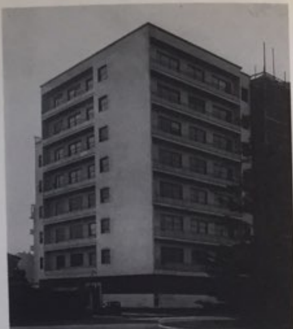
Gabriele Mucchi, casa d'abitazione in via Marconi, Milano, 1934. (Foto Archivio Mucchi, Milano.)

Nel 1934, poco dopo il rientro da Parigi, Mucchi progetta la sua opera architettonica più nota: la casa di via Marconi a Milano. Un edificio di otto piani, che inserisce nel contesto della zona, allora in corso di edificazione, una rete di modernità con facciate senza decorazioni da cui