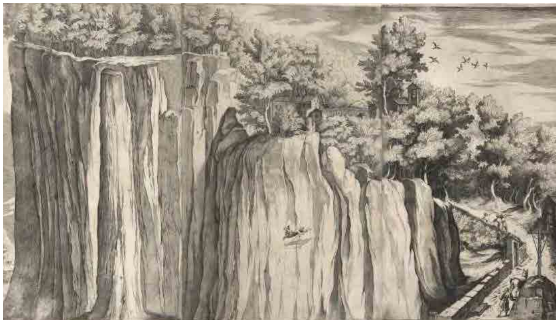
Fig. 10.3 – Jacopo Ligozzi, Vista della Montagna della Vernia dalla Strada del Casentino (Tavola A). Frà Lino Moroni, Descrizione del Sacro Monte della Vernia , 1612, National Gallery of Washington.

Come ricorda Lucilla Conigliello, si trattava di una sorta di «pellegrinaggio imposto al pittore per suscitare altri pellegrinaggi, reali e ideali» (Conigliello, 1999: 5) che diventerà la base per molte delle successive esplorazioni. Accanto alle descrizioni scritte troviamo numerose rappresentazioni pittoriche che contribuiscono a creare una sorta di iconografia consolidata dei luoghi sacri in Casentino, considerati di particolare ispirazione dagli artisti stranieri, come Jakob Philipp Hackert, trasferitosi in Toscana dalla Corte Borbonica alla fine del Settecento (Brilli, 2012; Brilli & Fiori 2016).