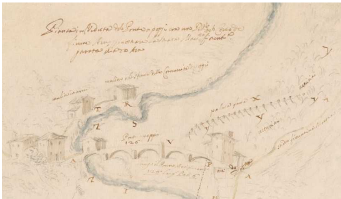
Fig. 10.2 – Piante dei Capitani di Parte Guelfa, Pianta e veduta del Ponte a Poppi con una parte del corso del Fiume Arno per dimostrare la Strada Maestra Fiorentina passata di sotto Arno, XVII sec. Archivio di Stato di Firenze.

Qualche decennio più tardi Emma Perodi, l'autrice delle Novelle della Nonna (Perodi, 1893) racconta il paesaggio casentino attraverso due differenti soglie temporali (un Medioevo leggendario e l'Ottocento reale della Mezzadria) intrecciate mediante l'artificio narrativo delle sue storie fantastiche, nelle quali «foreste, pievi e castelli costellano lo spazio narrativo della novellatrice» (Fonnesu, 2012: 209).