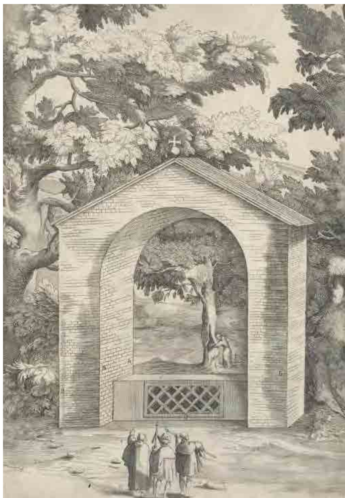
Fig. 10.4 – Jacopo Ligozzi, Cappella del Faggio dell'Acqua (Tavola Q). Frà Lino Moroni, Descrizione del Sacro Monte della Vernia , 1612, National Gallery of Washington.

monografia di Ella Noyes The Casentino and its story (1905), pubblicata a Londra e a New York.