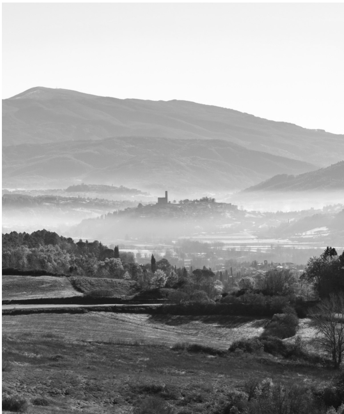
Fig. 10.1 – L'arrivo in Casentino dalla Consuma e la vista di Poppi. (Fonte Wikimedia Commons. Rielaborazione a cura dell'Autrice).