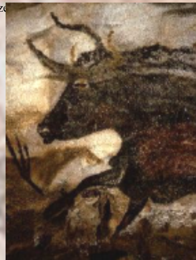
Fig. 1. Rappresentazione rupestre di Bos primigenius .

Le sequenze ottenute, allineate con ClustalW (Higgins 1992) e controllate successivamente manualmente, sono state sottoposte ad analisi filogenetiche attraverso la costruzione di un albero Neighbor-joining (Phylip) (8) utilizzando una matrice di distanza genetica ottenuta con il metodo Kimura due Parametri ( \alpha=0.14 ), il quale assume che esistano delle differenze nei tassi di