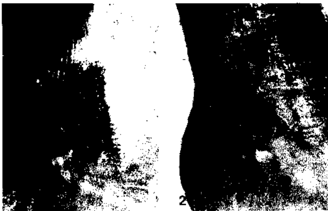
Fig. 1. — Ulcerazione malleolare esterna della gamba destra al giorno 0 (paziente n. 4). Si nota la presenza di una impronta reticolare dovuta alla apposizione di garza vaselinata. Fig. 2. — Ulcerazione malleolare esterna della gamba destra al giorno 14 (paziente n. 4). Si nota l'evidente riduzione dell'area ulcerata dovuta alla riepitelizzazione a partire dal bordo della lesione.