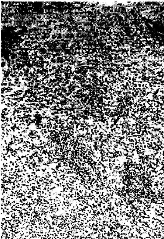
Fig. 3. — Caso 1. L'infiltrato è principalmente rappresentato da cellule istiocitarie in atteggiamento epitelioido e piccole cellule linfoidi.