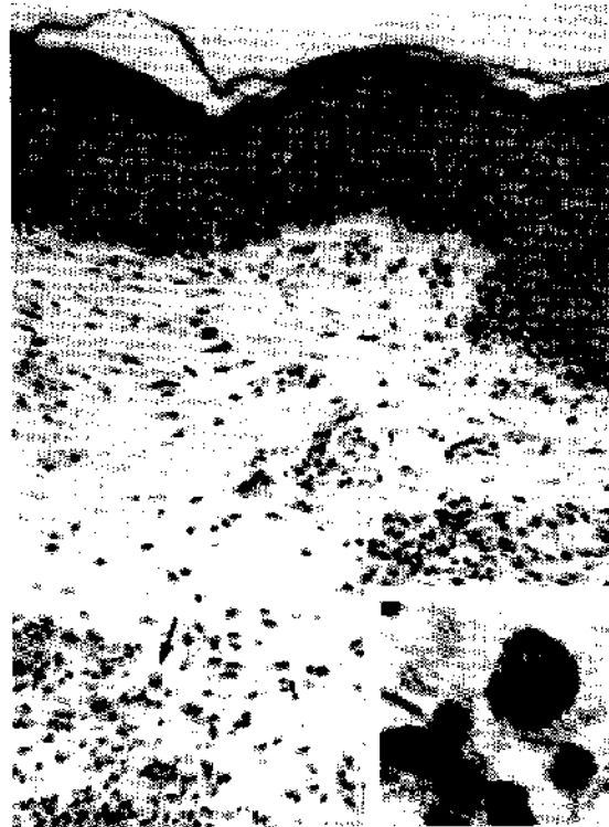
Fig. 4. — Caso 1. Nel derma superficiale è possibile osservare una cellula istiocitaria contenente alcune Leishmanie (freccia), chiaramente visibili a più forte ingrandimento (inset).