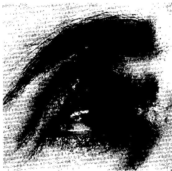
Fig. 1. — Caso 1. Lesione nodulare eritematosa della palpebra superiore destra; la zona centrale si presenta erosa.

Caso 1. — Donna, di 51 anni, abitante in campagna nella provincia di Grosseto, presenta a livello della palpebra superiore destra una lesione nodulare rotondeggiante, di circa mezzo cm di diametro, di colorito rossastro e di consistenza parenchimatosa, a limiti sfumati, lievemente pruriginosa; la zona centrale è erosa e translucida (fig. 1). Tale lesione si è sviluppata nell'arco di circa 3 mesi da una papula eritematosa.