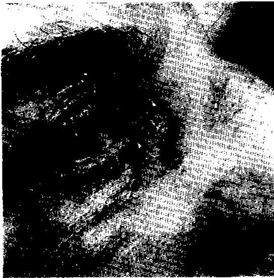
Fig. 5. — Caso 2, Chiazza eritemato-edematosa, lievemente infiltrata, della palpebra superiore destra; a livello del canto interno e del sopracciglio è ben evidente un fenomeno ulcerativo.

L'esame istologico della lesione ha evidenziato un'epidermide normale ed un infiltrato granulomatoso dermico (fig. 2). L'infiltrato era principalmente rappresentato da macrofagi, cellule epiteloidi, cellule giganti multinucleate, linfociti, plasmacellule; erano comunque presenti anche numerosi granulociti neutrofili (fig. 3).