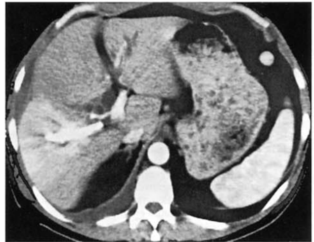
Fig. 1. — Arterializzazione del VI-VII segmento epatico nella trombosi portale acuta iatrogena. Impregnazione grossolanamente triangolare durante la fase della perfusione arteriosa.

La TC dell'addome immediatamente successiva alla trombosi conferma i reperti già noti con presenza di catetere transepatico nel ramo destro della vena porta. Nella fase contrastografica precoce è riconoscibile intensa, omogenea e fugace impregnazione del VI e VII segmento epatico, reperto non più visualizzabile durante la fase portale (fig.1).