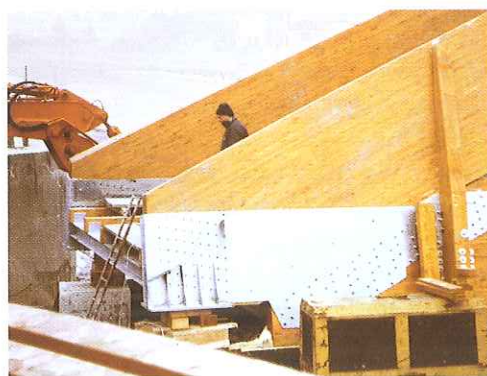
FIGURA 3. Unioni di questo tipo rendono indispensabili accurate opere di protezione del legno in assenza delle quali l'acqua, incanalata all'interno della scatola metallica, ivi rimane, causando il rapido e sicuro degrado biologico del materiale.

Sulla base di queste indagini, l'incollaggio potrà essere al massimo valutato “compatibile/non compatibile con le condizioni d'esercizio”, senza che peraltro si possa fornire alcun dato riguardo alla sua effettiva resistenza.