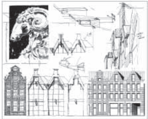
7 - 8 - 9 I resti delle sculture di Philip Vingboons per la casa del Gallo Rosso (Roo Haen) 10 Le case e la ricostruzione della Roo Haen: studi