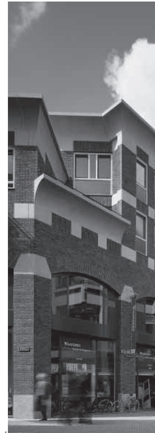
3 Sopralluogo, 11 novembre 1996 4 Schizzo della "casa gotica" verso la Broerkerkerk 5 Sulla piazza, 10 settembre 1998 6 I volumi prospicienti la piazzetta centrale