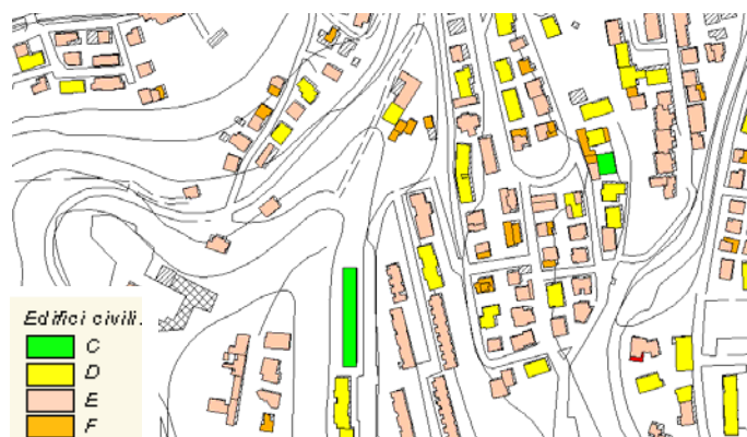
Figura 4 Particolare della classificazione del campione di fabbricati

Si osserva, inoltre, che la quasi totalità dei fabbricati (oltre il 99%) risulta in classe superiore alla C, che dovrebbe corrispondere a quella minima di legge per gli edifici di nuova costruzione. Tale esito è in linea con quello che si ottiene usando il programma di certificazione per gli edifici esistenti DOCET ( www.docet.itc.cnr.it ), che fornisce, prudenzialmente, valori dei consumi energetici sempre molto elevati.