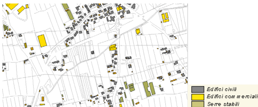
Figura 1 Visualizzazione dei layers degli edifici

A sua volta la cartografia è costituita da una serie di elementi (poligoni) individuati da codici che, se selezionati, evidenziano gli elementi che gli appartengono: in figura 1, ad esempio, è rappresentato il tema degli edifici, nel quale sono selezionati gli edifici residenziali, commerciali e le serre stabili. Nella figura 2 è rappresentata la tabella associata al tema in questione: nella prima colonna ( shape ) è identificata la caratteristica geometrica della cartografia, nella seconda, terza e quarta colonna si trovano rispettivamente il codice della carta tecnica regionale, il codice di identificazione del tipo di edificio e quello di identificazione dell'elemento ( record ); infine si trovano le informazioni utili alla identificazione delle caratteristiche geometriche di ciascun fabbricato espresse in termini di quote suolo e gronda, l'area del poligono, il volume e l'altezza (quota gronda - quota suolo).