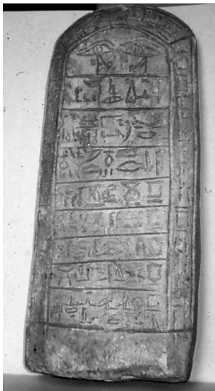
Tav. 2: stele Rovigo n. 12