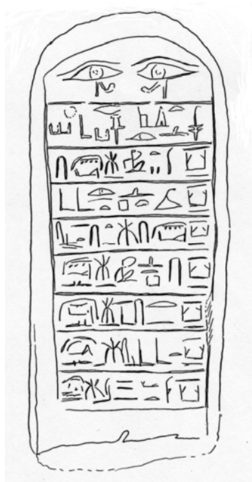
Fig. 5: stele Hermitage inv. 8729 (disegno di G.R.)