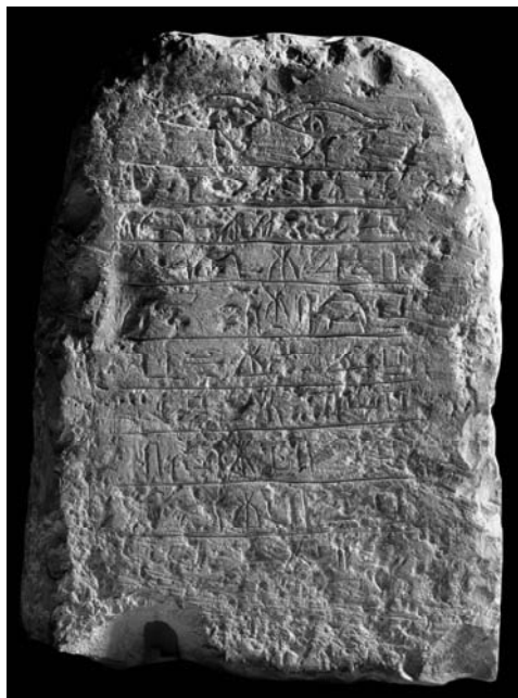
Tav. 1: CGC 20464