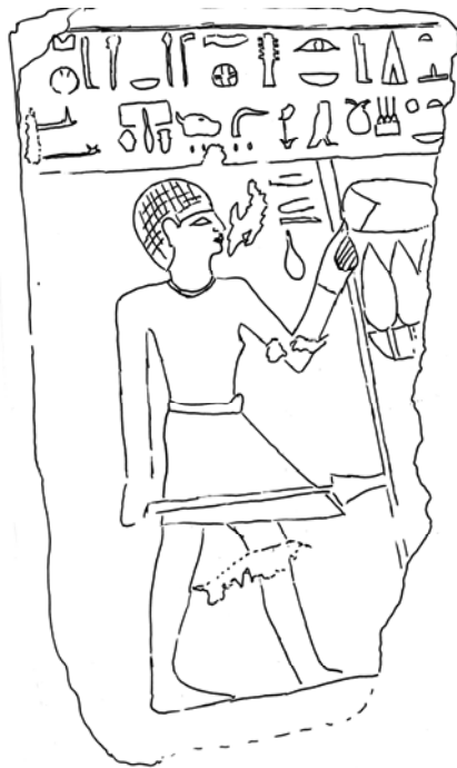
Fig. 3: stele a Dendera (El-Masry 2006, n. 2.1) (disegno di Gloria Rosati)