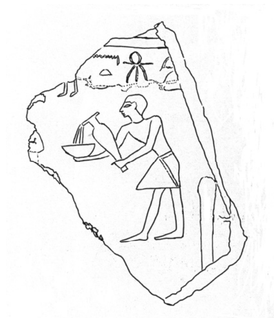
Fig. 2: frammento Museo Barracco inv. n. 320 (disegno di Gloria Rosati)