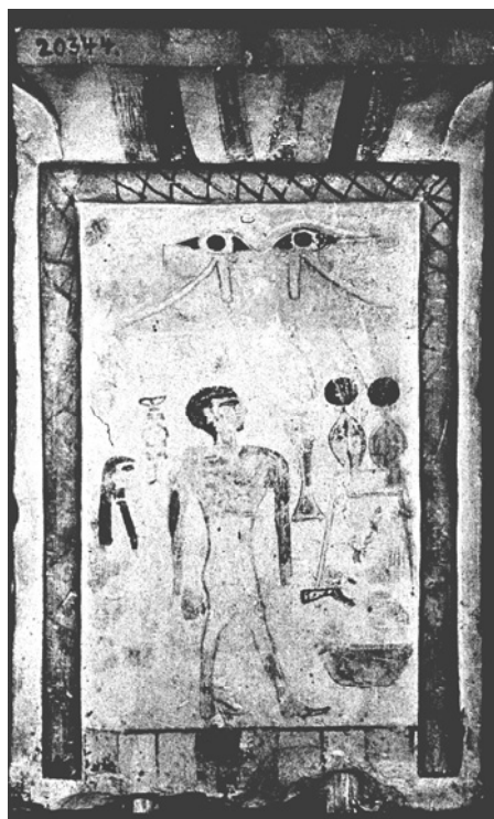
Tav. 3: CGC 20344, per gentile concessione dell'Egyptian Museum, Cairo (foto di Gloria Rosati)