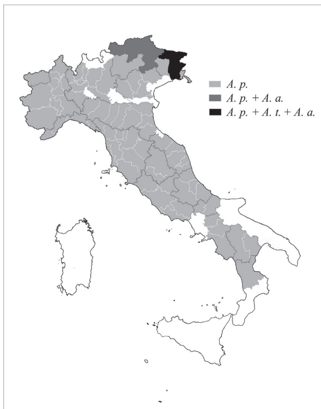
Fig. 1 - Province d'Italia con presenza di specie autoctone: Austropotamobius pallipes (Lereboullet, 1858) complex, Astacus astacus (Linnaeus, 1758) e Austropotamobius torrentium (Schrank, 1803) (indicate nella legenda come A.p., A. a. e A. t., rispettivamente). A causa della eterogeneità dei dati disponibili le carte di distribuzione sono state redatte sulla base della presenza o assenza delle specie nelle singole province d'Italia.

Fig. 1 - Italian provinces with presence of autochthonous species: Austropotamobius pallipes (Lereboullet, 1858) complex, Astacus astacus (Linnaeus, 1758) and Austropotamobius torrentium (Schrank, 1803) (denoted in the legend as A.p., A. a. and A. t., respectively). Because of the data heterogeneity, the distribution maps have been drawn in view of presence or absence of the species in the single Italian provinces.