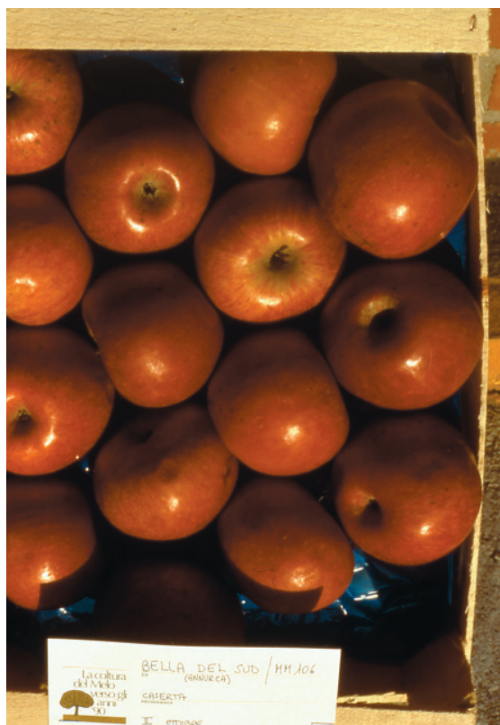
Fig. 5. Annurca: cultivar Campana, ancora coltivata per le ottime qualità gustative.

NUOVE FRONTIERE DELL'ARBORICOLTURA ITALIANA