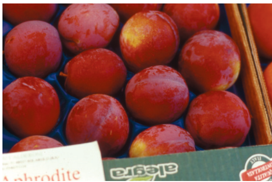
Fig. 19. Aphrodite: nuova cultivar cino-giapponese, ottenuta da Bubani, con grossa pezzatura, frutti un po' allungati di ottimo sapore.

Gold* (+5), a buccia gialla, che si evidenzia per la buona produttività dell'albero e per pezzatura, aspetto, consistenza e sapore. Le cv a buccia nera Black Gold® (+13) e Black Diamond® (+23), vengono giudicate positivamente per i caratteri pomologici anche se la produttività risulta incostante e scarsa al Centro-Nord. Alla fine del periodo intermedio maturano Golden Plumza* (+30), a buccia gialla e molto interessante per l'aspetto pomologico, Laroda (+25) e Friar (+31), a buccia nera e la rossa Fortune (+26) che si conferma la migliore per produttività e grossa dimensione dei frutti molto attraenti anche se il sapore non è sempre soddisfacente.