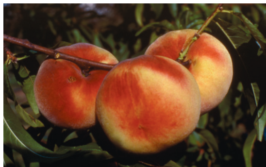
Fig. 8. Regina di Londa: vecchia cultivar a polpa bianca, appartenente al tipo "Burrone fiorentine", ancora coltivata ed apprezzata per le elevate caratteristiche organolettiche.

Nel periodo tardivo e molto tardivo tutte le cv in lista (tranne White Maeba) sono risultate valide al Sud; di esse solo la metà vengono promosse al Nord. Pienamente soddisfacenti i caratteri agronomici, più che sufficienti quelli pomologici. È da considerare che alcune di queste come Tardivo Zuliani (+36) e Regina Bianca (+40) sono di vec-