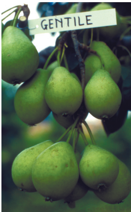
Fig. 25. Gentile: cultivar toscana a maturazione precoce, ancora presente al sud.

La maggior parte delle novità sono a maturazione estiva, prima di William, poche so-