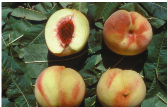
Fig. 3. Poppa di Venere: vecchia cultivar appartenente alla tipologia Burrone a polpa bianca, ormai non più coltivata.

tutto da alcuni consumatori di una certa età che ricordano gusti, aromi e profumi appartenenti a vecchie varietà, quasi sempre assenti nelle nuove.