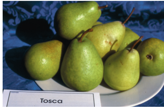
Fig. 28. Tosca: cultivar a maturazione medio-precocce (periodo Coscia), ottenuta presso il CRA-ISF, Sezione di Forlì:

Altre cv del periodo di costituzione un po' più recente come Ercole d'Este (+ 28), Sensation (+15) e Highland (+11) non soddisfano al Centro-Nord Italia mentre evidenzia-