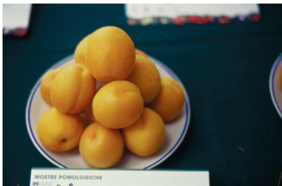
Fig. 23. Carmen Top: cultivar precoce, di recente costituzione, con produttività elevata e buoni caratteri pomologici.

Sembra fare eccezione, perlomeno dalle prime valutazioni, la nuovissima Kyoto (0), autocompatibile e adatta a tutti gli ambienti con particolare riguardo a quelli del Nord. Ricordiamo inoltre le medio-tardive Laycot®