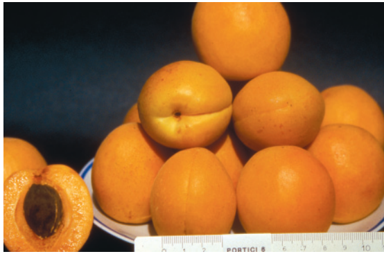
Fig. 22. Portici: cultivar vesuviana di tipo tradizionale, autofertile, molto diffusa per l'affidabilità produttiva e per i buoni caratteri pomologici.

tici (+4) (fig. 22.) tenuta in considerazione per il sapore e l'aspetto, Pisana (+12) e Dulcinea (+12) a maturazione tardiva.