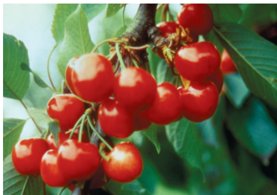
Fig. 13. Marchigiana: vecchia cultivar utilizzata per il consumo fresco e per la conservazione in alcol.