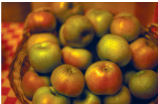
Fig. 29. Renetta del Canada: vecchia cultivar ancora diffusa e apprezzata per le pregevoli caratteristiche organolettiche.

goria ed un ritardo più o meno accentuato, a seconda della cultivar, nell'entrata in fruttificazione, riuscendo solo in particolari condizioni pedo-climatiche a raggiungere il loro standard produttivo.