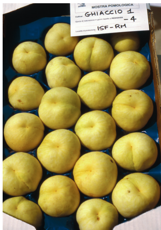
Fig.2. Ghiaccio 1: una delle cultivar della serie "Ghiaccio" costituite presso il CRA, Istituto Sperimentale per la Frutticoltura di Roma.

Riguardo alle caratteristiche organolettiche occorre fare alcune precisazioni. Sempre più spesso infatti vengono espressi giudizi negativi sulla qualità delle pesche, soprat-