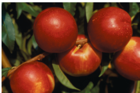
Fig. 10. Maria Dolce: cultivar ottenuta presso il DOFI (Firenze), caratterizzata da maturazione tardiva, elevato tenore zuccherino, di tipo "gusto miele".

gialle del periodo tardivo; resta esiguo il numero di queste adatte al Nord, mentre fra le più interessanti troviamo: Sweet Red® (+33) Maria Dolce* (+34) (fig. 10.), Sweet Lady* (+38), Laura Dolce (+44), Lady Erica® (+46), Morsiani 90® (+54) e August Red® (+55).