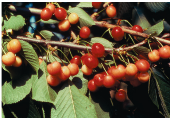
Fig. 12. Bella di Pistoia: vecchia cultivar locale con buoni caratteri pomologici.