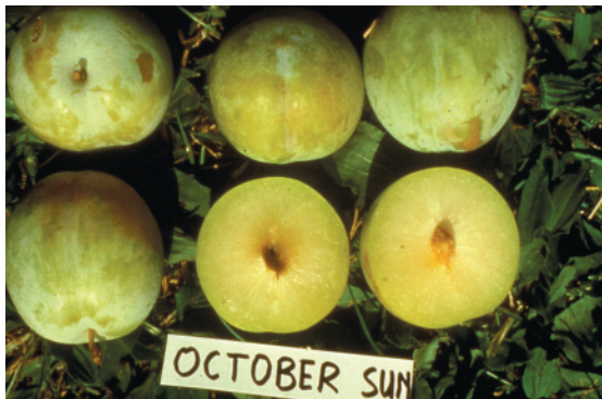
Fig. 18. October Sun: cultivar cino-giapponese, a maturazione tardiva, molto produttiva e con frutto molto grosso.