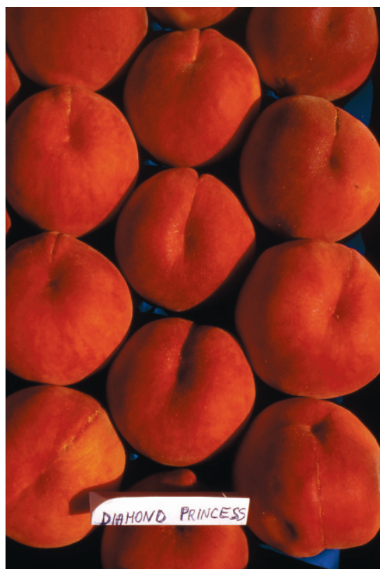
Fig. 6. diamond Princess, una delle più interessanti pesche a polpa gialla di origine americana, che ha contribuito a creare un nuovo standard merceologico-qualitativo delle nuove tendenze mercantili.

Nel periodo tardivo maturano cultivar valide sia dal punto di vista agronomico che pomologico; quasi tutte si contraddistinguono per buona pezzatura, consistenza e sapore dei frutti. Il grado zuccherino, in generale, aumenta passando da Nord a Sud; viceversa, l'acidità diminuisce. In questo pe-