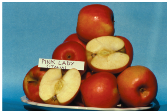
Fig. 31. Pink Lady: cultivar australiana, molto innovativa, a maturazione tardiva, tra le più apprezzate nei nuovi impianti nelle aree adatte.

Tra i cloni risanati e diffusi in Italia troviamo