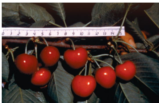
Fig. 15. Canada Giant: cultivar con buone caratteristiche pomologiche, di grossa pezzatura.

ni secondo l'ambiente, rispetto a Burlat che si raccoglie dal 5 al 10 giugno nelle zone alpine, dal 25 al 30 maggio nella Pianura Padana, dal 20 al 25 maggio al Sud), Early Lory* (-4) di origine francese e Sweet Early® Panaro 1* (-3), italiana, in grado di migliorare l'aspetto produttivo e pomologico; la prima e la terza varietà sono autofertili. Nella settimana successiva a Burlat matura Early Star® Panaro 2* (+6), seguita dalla californiana Brooks* (+10), valutata solamente nelle pianure del Nord. Questo gruppo è caratterizzato da maturazioni piuttosto scalari (tranne Sweet Early®) ed elevata suscettibilità dei frutti alle spaccature da piogge durante la maturazione ( cracking ), per cui sono raccomandati sistemi di difesa soprachioma dei filari con coperture plastiche (reti e teli).