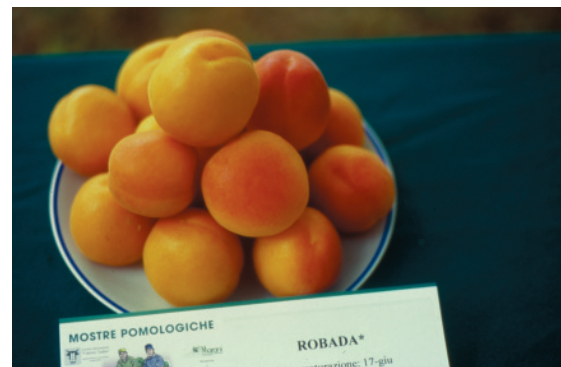
Fig. 24. Robada: cultivar californiana di recente costituzione, di grossa pezzatura, colorazione rossa ed elevata consistenza della polpa.

La selezione clonale di P. armeniaca Manicot® 1236 è sicuramente da suggerire in so-