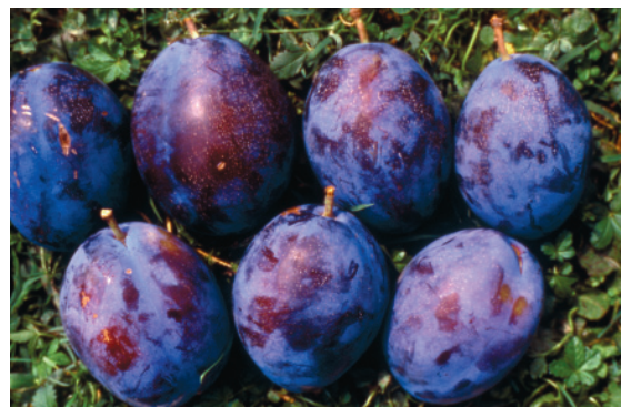
Fig. 20. Empress: cultivar europea a maturazione tardiva, di grossa pezzatura, molto suscettibile alle virosi.

È nel periodo tardivo che maturano le cv che concorrono a formare la maggior parte della produzione italiana di susine europee. Per il consumo fresco si riconfermano Empress (+2) (fig. 20.), President (+9) e Stanley. Per l'essiccazione la vecchia D'Ente 707 (-3), risulta ancora la migliore sotto il punto di vista pomologico, registrando elevati tenori zuccherini e soprattutto bassa acidità; Sugar Top®(-13), invece, di recente costituzione, sta mostrando scarsa attitudine a questa trasformazione industriale (tab. 7, Susino europeo – Nuove cultivar).