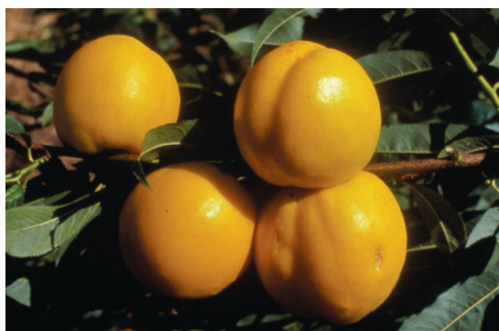
Fig. 11. Maria Dorata: nuova nettarina-percoca deantocianica, ottenuta presso il DOFI (Firenze).

Le 21 cv di percoche giudicate idonee in lista maturano in un arco estivo di poco più di due mesi, ma solo poche sono considerate idonee all'industria di trasformazione (tab. 4, Percoche - Nuove cultivar). In generale, come ribadito per gli altri gruppi pomologici, tutte sono giudicate positivamente