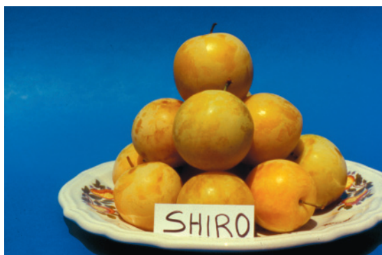
Fig. 16. Shiro: cultivar cino-giapponese, caratterizzata da grossa pezzatura dei frutti, ormai non più coltivata.

Tra le varietà a maturazione precoce troviamo ancora in lista Sorriso di Primavera (-12 gg dalla cv di riferimento Shiro (fig. 16.), che matura dal 10 al 15 luglio al Nord, dal 5 al 10 luglio al Centro, dal 1 al 5 luglio al Sud, impiegata essenzialmente per la grande capacità impollinante); Obilnaja (-4),