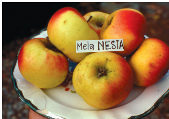
Fig. 30. Melo Nesta: vecchia cultivar toscana, a maturazione tardiva, rustica e di facile conservazione.

Dominano i cloni del gruppo Gala, dove è generalizzata la preferenza per le varietà a frutto striato come Galaxy* (-27 gg dalla cv di riferimento Golden Delicious, che matura il 16 settembre a Bolzano, il 22 settembre a Cuneo), clone di riferimento del gruppo