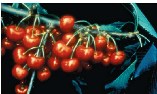
Fig. 14. Giorgia: cultivar precoce costituita presso l'ISF di Verona, molto diffusa e apprezzata per i caratteri pomologici e la produttività elevata e costante.