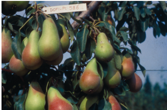
Fig. 27. Etrusca: cultivar precocissima ottenuta presso il DOFFI – Firenze, che si caratterizza per l'elevata produttività e per il buon sapore dei frutti.

William, cultivar di riferimento, che matura dal 25 luglio al Sud, metà agosto al centro 20 agosto al Nord), diffusa al Centro-Sud, apprezzata sia per la costanza di produzione che per la qualità dei frutti; Etrusca (-43) (fig. 27.), con frutti di bell'aspetto, valida per le zone centrali e meridionali; Turandot (-39), i cui frutti presentano buona tenuta alla maturazione.