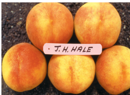
Fig. 1. J.H. Hale: vecchia cultivar di origine americana, a polpa gialla, di grossa pezzatura, androsterile, ha fatto storia per oltre cinquant'anni.

I cambiamenti sostanziali hanno principalmente riguardato soprattutto i caratteri pomologici e solo in parte sono stati migliorati quelli agronomici, che in molti casi sono divenuti peggiorativi. Se è vero, infatti, che le nuove cv non manifestano più problemi di sterilità morfologica (androsterilità) che si riscontravano in qualche vecchia varietà (ad esempio J.H. Hale) (fig. 1.), spesso, esse si dimostrano meno rustiche, più incostante-