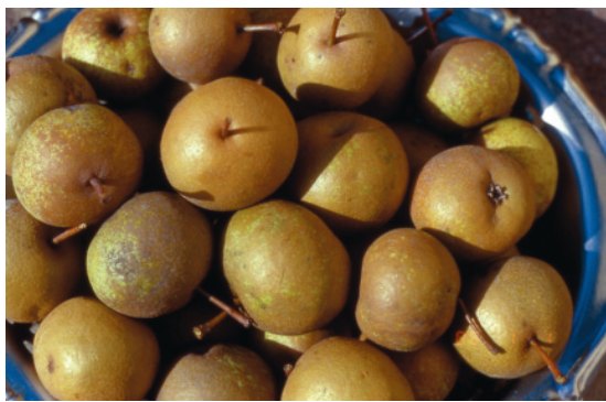
Fig. 26. Pera Volpina: altra cultivar tardiva, adatta solo alla cottura, ancora presente in Romagna.

no invece le nuove cultivar a maturazione autunnale dotate di caratteri agronomici e pomologici migliori delle cultivar attualmente coltivate (tab. 8, Pero – Nuove cultivar).