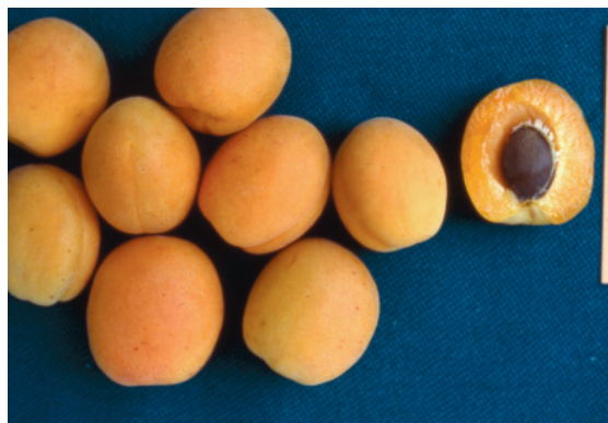
Fig. 21. Boccuccia Spinosa: vecchia cultivar vesuviana, a maturazione tardiva, ancora coltivata.

È particolarmente indicato per varietà vigorose coltivate in terreni fertili. Tra gli ibridi di Mirabolano ricordiamo l'MrS 2/5 ( P. cerasifera × P. spinosa ), un portinnesto nato per il pesco che può essere utilizzato anche per albicocco e susino.