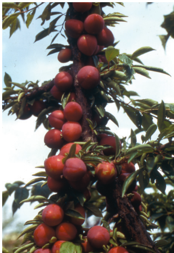
Fig. 4. Morettini 355: vecchia cultivar cino-giapponese, con produttività elevata e costante.

mente abbandonate o relegate a nicchie di mercato.