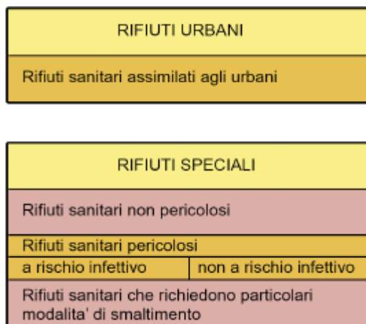
Figura 1. Tipologie di rifiuti prodotti all'interno degli ospedali

Nel perseguire obiettivi di sostenibilità, la normativa europea ed italiana in tema di rifiuti spinge verso l'adozione di politiche rivolte all'intero ciclo del prodotto che a fine vita diventa rifiuto, specificando che le pubbliche amministrazioni devono recuperare o smaltire rifiuti senza mettere a rischio la salute dell'uomo o arrecare pregiudizio all'ambiente, e favorire la riduzione dello smaltimento dei rifiuti attraverso: