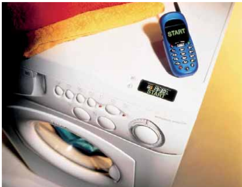
Figura 4 – Lavabiancheria “Margherita2000.com”.

Da allora, il design dell’interfaccia e dell’interazione con il prodotto è diventato fondamentale per creare un dialogo tra l’elettrodomestico digitale e l’utente, al fine di progettare un’esperienza col prodotto che porti a risparmiare tempo, denaro ed energia. Dal rapporto Electricity Consumption and Efficiency Trends in the European Union , pubblicato il 30 novembre 2009 dall’Istituto per l’Energia, risulta che il 30% dei consumi generali di energia elettrica è da attribuire alle abitazioni, e per la metà (15%) agli elettrodomestici. Per contribuire al risparmio energetico in maniera proattiva, nel 2009 la Indesit Company iniziò un progetto DDC (Dinamyc Demand Control) in collaborazione con un’azienda di servizi inglese, la Rltec, al fine di applicare un concetto scoperto dal MIT negli anni Sessanta, a una serie di frigoriferi distribuiti sul territorio britannico. Gli americani avevano capito che le variazioni millesimali della frequenza della rete elettrica dipendevano dalla disponibilità di energia sulla rete. In particolare, se in una certa area la quantità