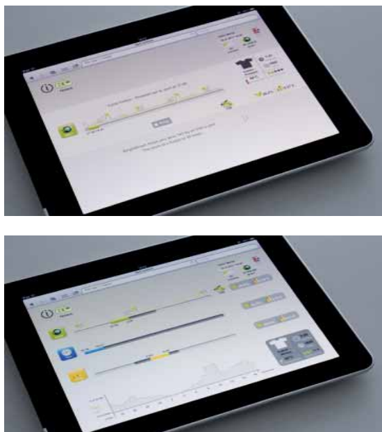
Figura 5 – BrightGreen Interfaccia-Scelta Green (in alto) e BrightGreen Interfaccia-Utente (in basso).