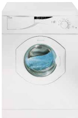
Figura 2 – Lavabiancheria "Margherita Dialogic/intelligenza di prodotto".

Questa lavabiancheria, risultato di cinque anni d'intensa ricerca e sperimentazione, dieci brevetti presentati e oltre 10