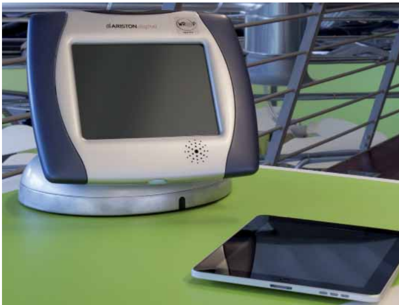
Figura 3 – Tablet: “Leon@rdo”, 1999, e iPad, 2010.

monitorare i vari elettrodomestici e accedere al mondo di Internet dalla cucina.