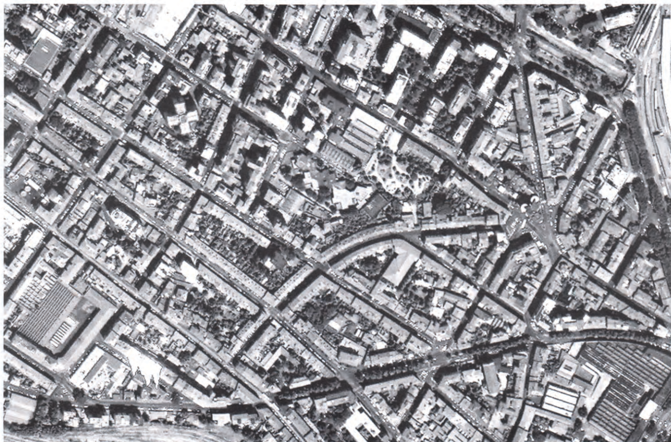
Veduta aerea del tessuto edilizio dell'Utoe San Jacopino.

centrale l'elemento strutturante l'Utoe, l'elemento che ne giustifica la valenza urbana e le conferisce qualità e valore strategico.