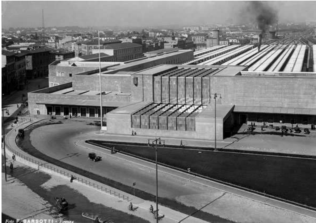
Figura 2: Foto d'epoca della stazione di Santa Maria Novella a Firenze, progetto vincitore del concorso del 1932 (Gruppo Toscano)