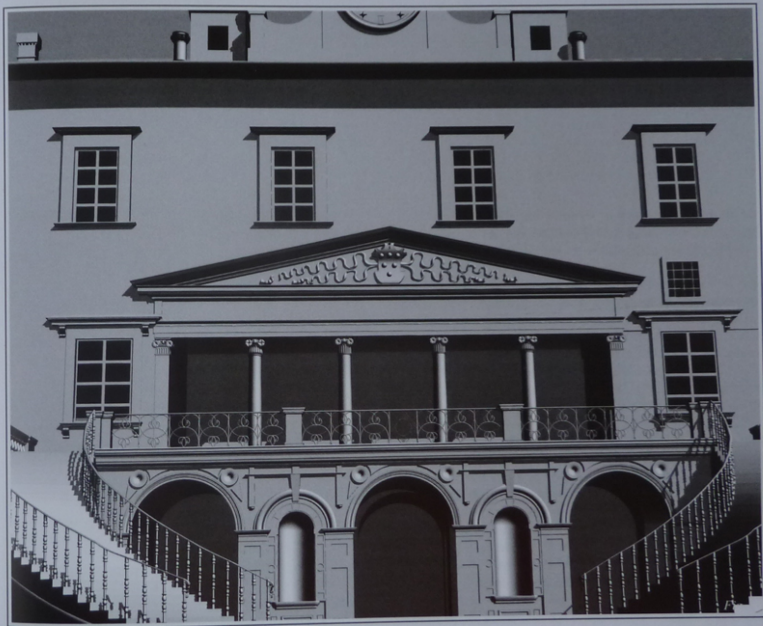
Fig. 13 Villa medicea di Poggio a Caiano. Modello tridimensionale della villa di Poggio a Caiano allo stato attuale. Le scale anteposte alla facciata sono quelle su pianta semicircolare progettate da Poccianti nel 1807 (da tesi di laurea di Francesca Grillotti).