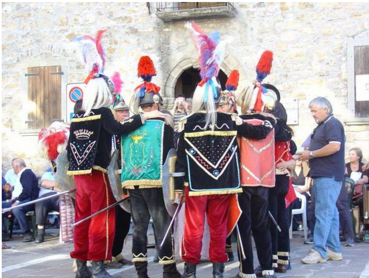
Villa Minozzo (RE), 24.08.2008 Compagnia del Maggio Valdolo (RE) Maggio I fratelli ammutinati

consoni alla vicenda rappresentata; oppure il suggeritore/regista sempre più frequentemente interrompe il canto, si rivolge al pubblico anticipando e riassumendo larghe sezioni della trama del testo per esplicitare quei passaggi che di norma venivano lasciati all'intuizione degli spettatori. Altre variazioni si registrano per tutti quegli accorgimenti adottati, relativi a scenografia e recitazione, nel tentativo di introdurre elementi di veridicità in uno spettacolo che ne era esente.