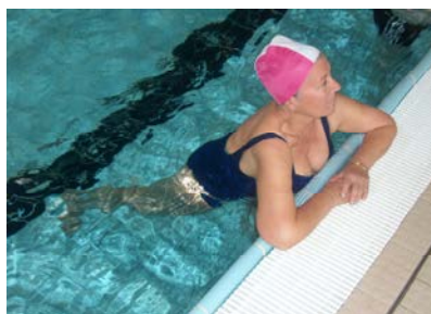
fig. 6 Estensione anca-ginocchio