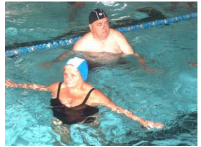
fig. 16 Rotazione tronco