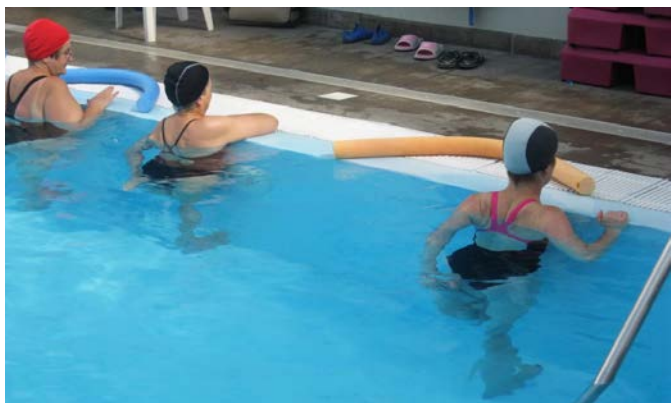
fig. 24 Stretching quadricipite