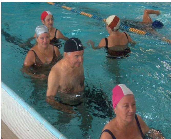
fig. 2 Cammino a ginocchia alte

Questi primi esercizi si possono eseguire anche in cerchio tenendosi per mano (sensazione di sicurezza e quindi di rilassamento).