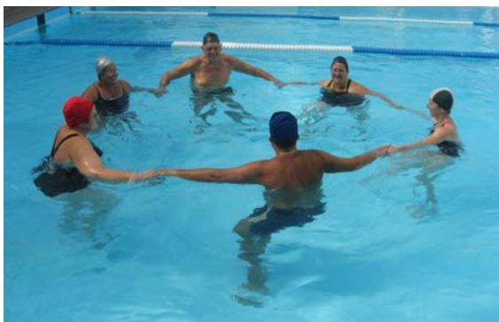
fig. 3a Esercizi in cerchio tenendosi per mano

Il cammino, in avanzamento o sul posto, può essere accompagnato da diversi movimenti degli arti superiori o alternato con quelli degli arti inferiori (vedi oltre).