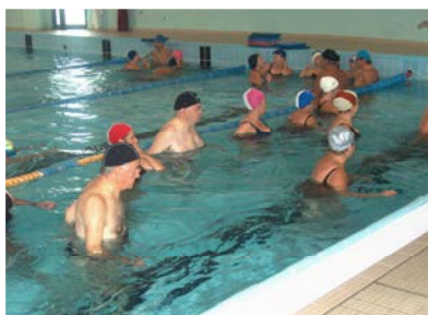
fig. 5 Flessione anca-ginocchio

- calcio avanti: consiste in una flessione-estensione dell'arto. Si chiede di terminare l'esercizio con una completa flessione plantare del piede; dopodiché il piede ritorna in appoggio. Una variante è rappresentata dall'esecuzione dello stesso esercizio con appoggio della colonna vertebrale al bordo vasca per mantenere il corretto allineamento del corpo (fig. 7);