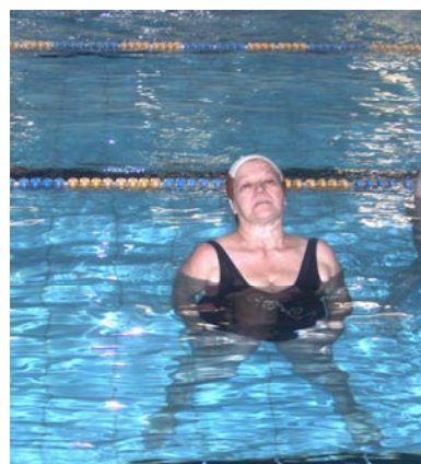
fig. 31 Inclinazione latero-cervicale