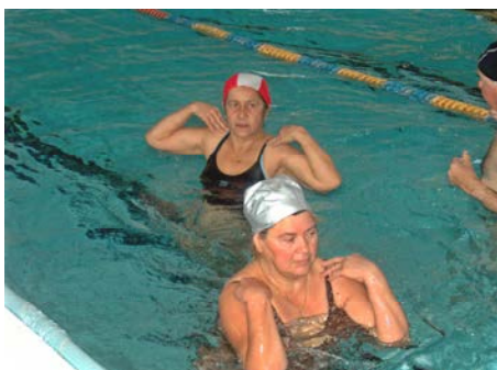
fig. 19 Rotazioni spalle