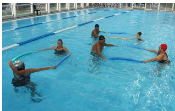
fig. 26 Apertura arti inferiori e arti superiori