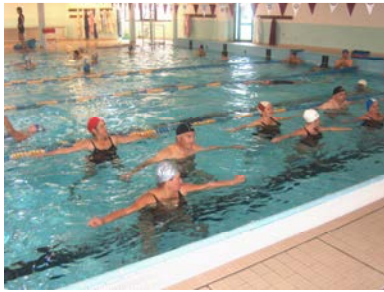
fig. 14 Prono-supinazione aa sup