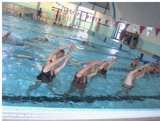
fig. 29 Inclinazione laterale rachide