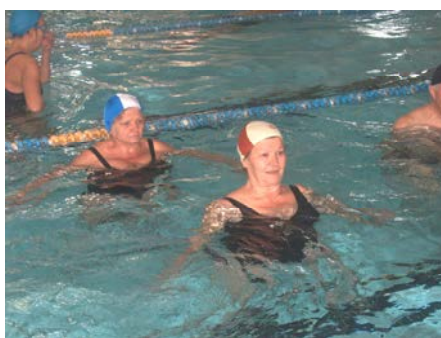
fig. 12 Apertura-chiusura arti inferiori