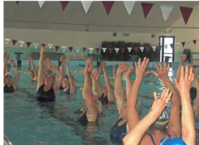
fig. 10 Elevazione arti superiori

- elevazione arti superiori: l'arto, mantenuto disteso con avambraccio pronato e mano aperta, si solleva verso la superficie dell'acqua fino ad arrivare all'altezza delle spalle e poi torna verso il basso. Una variante consiste nella supinazione dell'avambraccio durante il sollevamento e sua pronazione durante il ritorno (Fig. 10). Lo stesso esercizio può essere effettuato con le spalle fuori dall'acqua chiedendo al soggetto la massima elevazione dell'arto superiore; si sfruttano così le proprietà di entrambi i mezzi: acqua e aria. Questo esercizio consiste in una flessione (da 0° a 90°) e in una successiva elevazione della spalla (da 90° a 180°). Importante è porre l'attenzione sull'inspirazione durante la flessione delle spalle e sull'espirazione durante la loro estensione.