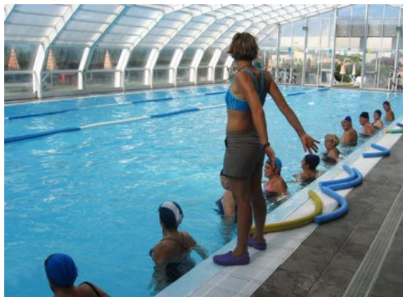
fig. 4a Estensione spalle

Si può effettuare lo stesso esercizio con flessione dorsale del piede oppure in avanzamento riunendo gli arti (piedi a contatto) alla fine del movimento. Per agevolare l'equilibrio qui sarà importante associare il movimento degli arti superiori, per esempio l'estensione delle spalle che è un movimento in opposizione (fig. 4a);