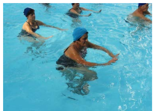
Fig. 18 Flessione anca a ginocchio flesso