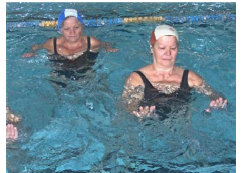
fig. 21 Es arti. Sup.