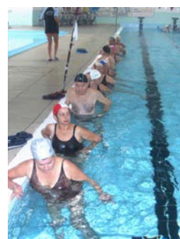
fig. 13 Calcio laterale

Una variante è rappresentata dall'esecuzione dell'esercizio precedente con le spalle fuori dall'acqua eseguendo l'abduzione completa fino a 180° (si effettua quindi un'elevazione dall'abduzione grazie ad una rotazione esterna della spalla). Inoltre si può associare la supinazione dell'avambraccio durante il sollevamento inspirando e la sua pronazione durante il ritorno espirando (fig. 14).