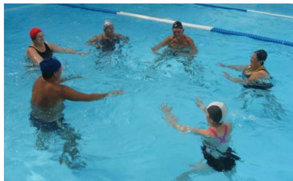
fig. 3b Esercizi in cerchio