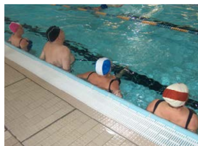
fig. 7 Calcio avanti

- sforbiciate: sono delle aperture simultanee degli arti inferiori che si distendono con appoggio dei piedi sul fondo vasca (salto e riunione sul posto). L'esercizio richiede una flessione degli arti, necessaria per effettuare quel piccolo salto verso l'alto che, a sua volta, consente il cambio di direzione (avanti-dietro). La sforbiciata si può effettuare anche senza la fase di volo ma attraverso uno scivolamento dei piedi sul pavimento (fig. 8);