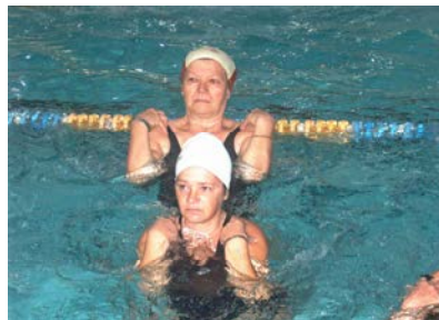
fig. 9 Flesso-estens. avambraccio