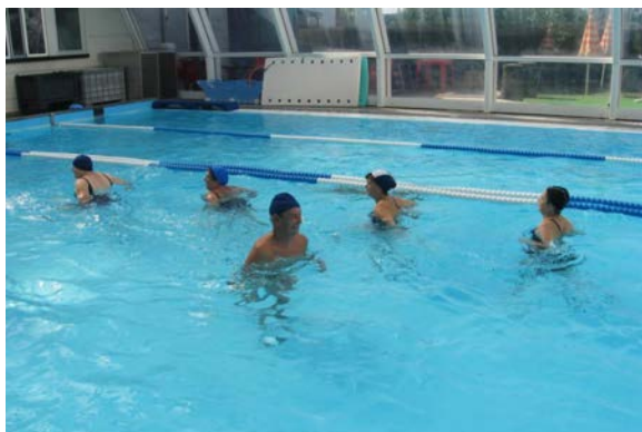
fig. 22 Cammino a velocità decrescente

In questa fase è utile riproporre alcuni degli esercizi visti precedentemente nella fase di riscaldamento: dapprima il cammino anche in ordine sparso (fig. 22), con velocità decrescente per favorire un graduale decremento dell'attività aerobica, in seguito esercizi di respirazione, presa di coscienza del proprio corpo, rilassamento e, come nell'attività a secco, di stretching per allungare tutti i distretti muscolari, in particolare quelli più sollecitati nel lavoro precedente. Assai utili sono gli attrezzi come i galleggianti (fig. 23), e l'appoggio al bordo vasca per gli estensori e flessori d'anca, lo stretching del quadricipite (fig. 24) e il bicipite femorale, i dorsali e i pettorali. Si propongono anche esercizi da eseguire in coppia (fig. 25, fig. 26) e in gruppo (fig. 27).