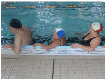
fig. 11 Ab-adduzione arti inferiori

- calcio laterale: si associa all'esercizio precedente una flesso-estensione dell'arto inferiore. Si effettua anche con appoggio al bordo vasca dell'arto superiore controlaterale per avere un miglior controllo della postura (fig. 13);