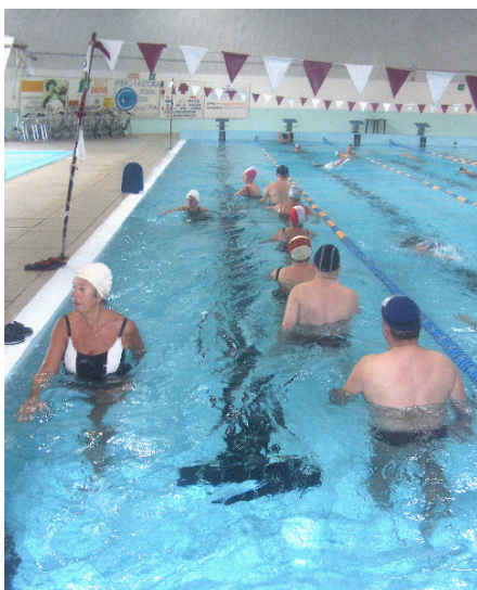
fig. 1 Cammino

Cammino con avanzamento (fig. 1): dopo l'ingresso in acqua è il primo esercizio che si effettua percorrendo, l'uno dietro l'altro, il perimetro della vasca. È un movimento ciclico degli arti inferiori, che richiede la flessione della coscia sul bacino e la successiva estensione di tutto l'arto inferiore. Anche gli arti superiori sono coinvolti con oscillazioni di assecondamento, non ponendo attenzione sul loro movimento essendo l'obiettivo primario la messa in moto generale del corpo, la percezione degli arti inferiori con l'acqua e dunque della resistenza che il mezzo offre all'avanzamento del corpo. Si può variare progressivamente la sua velocità fino ad ottenere la marcia (cammino sul posto) e la corsa (qui a differenza del cammino si ha una fase di volo). Una variante è rappresentata dal cammino a ginocchia alte (fig. 2).