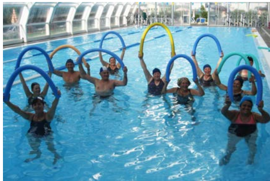
fig. 27 Braccia alzate con tubo "a volta"