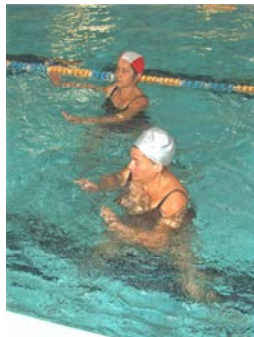
fig. 20 Es.arti. sup.