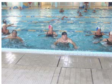
fig. 8 Sforbiciata