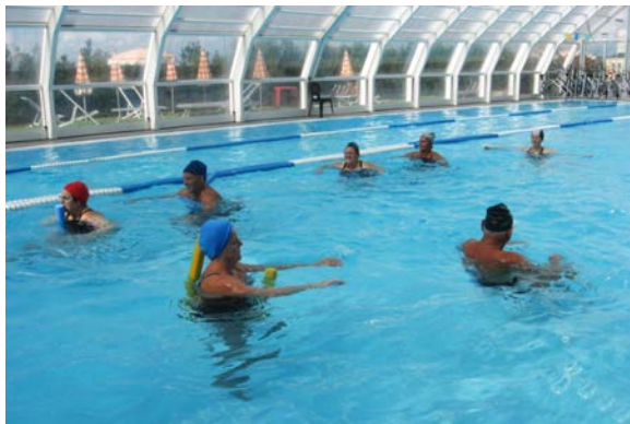
fig. 23 Cammino con tubi galleggianti