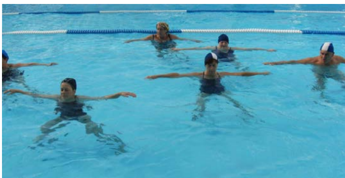
Fig. 17 Apertura-chiusura arti superiori