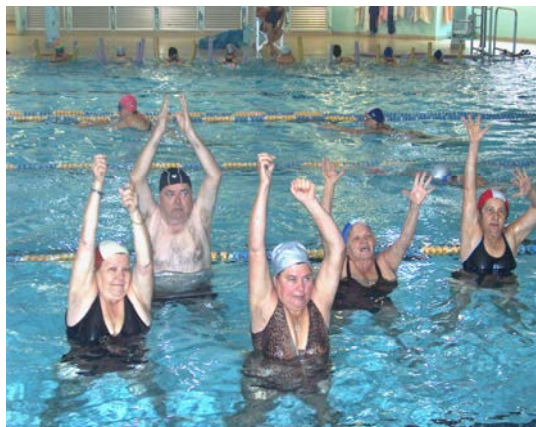
fig. 28 Allungamento rachide

Importanti sono gli esercizi per la mobilità della colonna vertebrale (fig. 28, 29, con particolare attenzione a quelli per il tratto cervicale).