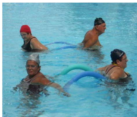
fig. 25 Cammino laterale