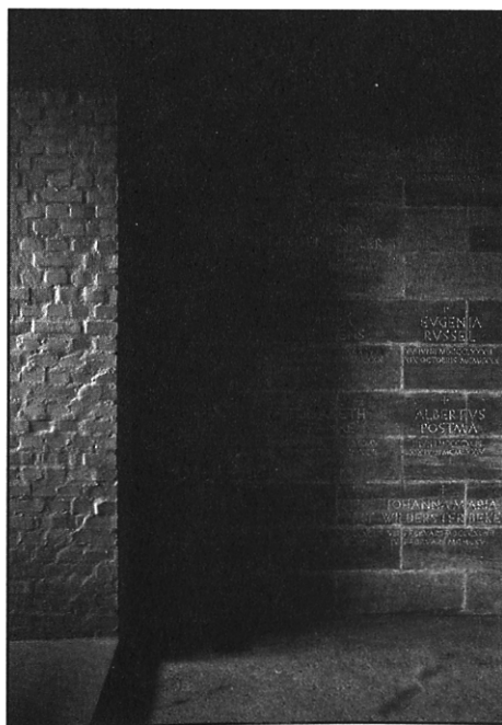
Cripta: il muro di pietra inciso (foto 010lab).