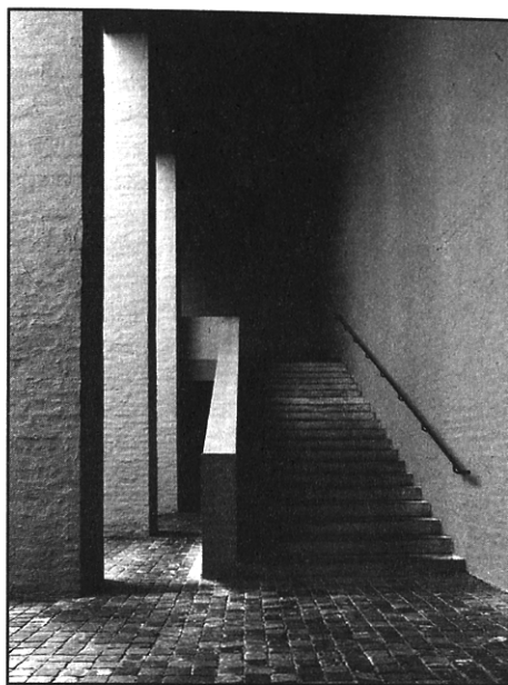
Atrio di ingresso: la scala che conduce alla chiesa.

In confronto al backsteinexpressionismus proprio della preesistenza la lingua dell'addizione si offre, a un primo sguardo, con i codici dell'architettura rurale dell'intorno. Se lo storicismo colto e la téchne attraversata da virtuosismi di Böhm fanno del suo intervento una sorta di elegante residenza nobiliare le muraglie laaniane, spoglie di licences , sembrano appartenere alla famiglia degli annessi rustici, di servizio. Ed è su questo registro ordinario, comune, che la tecnica d'invenzione del monaco impone le sue misure, vale a dire il suo metron . Il ritmo e la sintassi del metro è l'autentico e unico artefice capace di destare alla vita la materia inerte e farne un corpo vivente secondo i fini indicati da un altro baumeister benedettino, dom van der Mey. Dunque nessuna prova di innovazione, nessuna concessione al gesto spiazzante, nessun ou-tópos da raggiungere. Piuttosto il caso di studio che chiude al capitolo quindicesimo l'intero costruito speculativo del De Architectonische Ruimte è il santuario religioso di Stonehenge a nord di Salisbury. Una scelta che più che rispondere a una nostalgia, a un'ipostatizzazione del trascorso, è attenzione al senza-tempo di