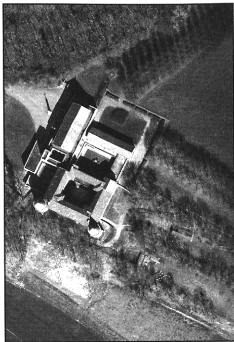
Sint Benedictusberg a Mamelis Vaals, foto aerea.

dei suoi giusti rapporti ( ex membris conveniens consensus – poiché l'ordine riguarda unicamente i rapporti reciproci fra le dimensioni dell'edificio.