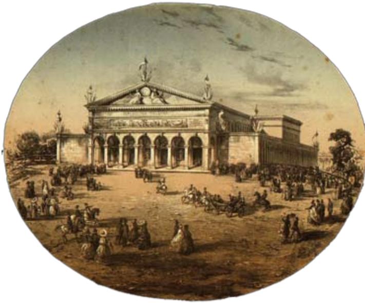
1. Giuseppe Martelli, La facciata della Stazione Leopolda durante l'Esposizione Italiana di prodotti Agrari, Industriali e di Belle Arti (litografia), 1861

comunità ebraiche italiane. Anche se molti provenivano da altre regioni, con la presenza schiacciante di esponenti piemontesi, ad esclusione dello Stato Pontificio e delle regioni del Meridione, si è qui limitata la disamina esclusivamente agli espositori toscani, consapevoli però che una mappatura più ampia potrebbe essere utile per precisare i settori nei quali gli ebrei stavano impostando le proprie attività economiche, differenziandole da quelle che erano state peculiari nell'età del ghetto. In pratica, si è cercato di capire, attraverso un panorama certamente parziale, se già negli anni appena precedenti l'Emancipazione vi fosse stato da parte degli ebrei toscani una trasformazione del proprio ruolo all'interno del tessuto produttivo e in che percentuale essi fossero partecipi delle attività che avrebbero dovuto caratterizzare sia per gli organizzatori dell'evento, sia agli occhi del mondo la nuova realtà italiana.