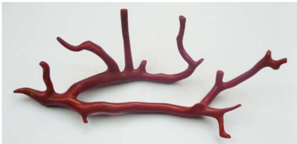
5. Livorno, Ramo di corallo , Firenze, Collezione privata