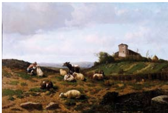
7. Serafino De Tivoli, Paese con animali (olio su tela), 1861, Torino Galleria d'arte moderna-

luschi e che sarebbe diventato a breve il curatore della Collezione Centrale Italiana di Paleontologia dell'Università di Firenze.