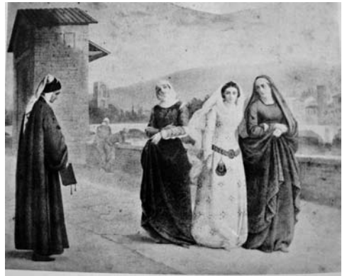
6. Vito D'Ancona, Dante incontra Beatrice , 1861, Collezione privata

Al contrario, gli altri maestri partecipanti nel 1861 furono rappresentati da dipinti di tutt'altro tenore 37 . Vito D'Ancona, allora poco più che trentenne, scelse un dipinto di stampo storicistico con Dante Alighieri che s'incontra con Beatrice (Fig. 6), un tema niente affatto consueto nella sua poetica 38 , interessata ad ambientazioni di interni, ritratti e paesaggi e fortemente influenzata dalle novità macchiaiole 39 . Tuttavia, il tema dantesco era uno dei più amati in que-