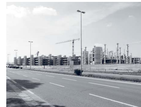
La Scuola dei Marescialli dei Carabinieri di Giovanni Destro Bisol in costruzione nell'area di Castello, a Firenze. Sotto, ancora a Firenze, il parco di Novoli con sulla sinistra il Palazzo di Giustizia di Leonardo Ricci. Pagina a fianco, San Rossore a Pisa costituisce un esempio di paesaggio storico perfettamente conservato. L'immagine di Andrea Barghi è tratta dai due volumi "Il Rinascimento del Paesaggio" (Pacini Editore), promossi da Regione Toscana e curati da De Angelis e Conti.