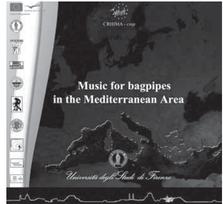
CD "Music for bagpipes in the Mediterranean Area", with sounds and music of the Mediterranean area.