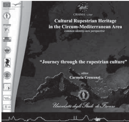
CD documentary "Journey through the rupestrian cultures".