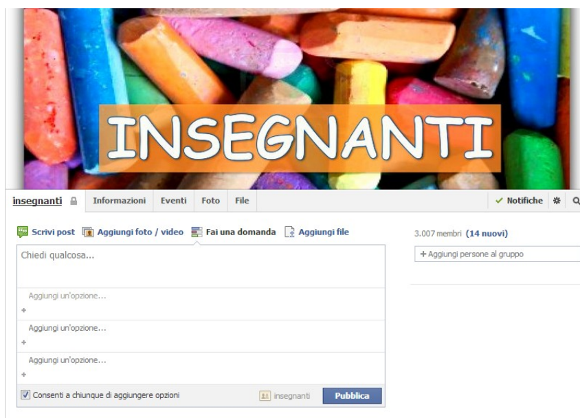
Figura 3. Screenshot della funzionalità “Fai una domanda”.

Il questionario è stato creato dalla fondatrice, avvalendosi di una funzionalità di Facebook che può essere utilizzata da tutti i membri del gruppo. Si tratta dell’opzione: “Fai una domanda”, che consente di scrivere una domanda e le relative risposte: