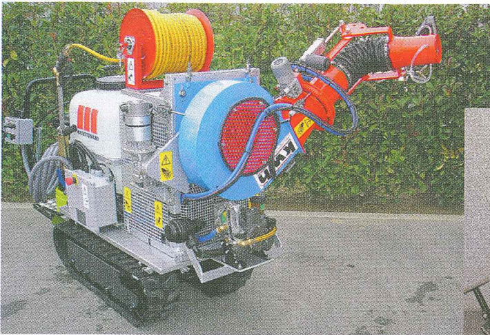
Configurazione con cannone omnidirezionale