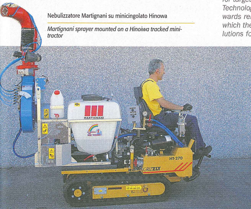
Martignani sprayer mounted on a Hinoiwa tracked mini-tractor