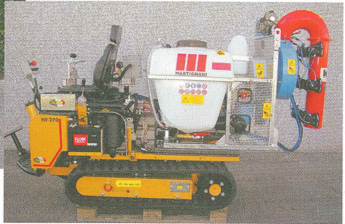
Configurazione con diffusori a bocchetta per la viticoltura