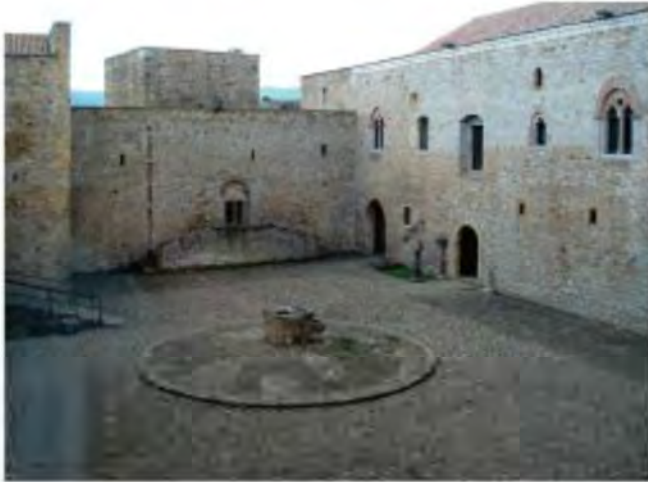
3/Cortile maggiore del castello con al centro la cisterna. The greater courtyard castle with a central tank.