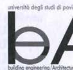
Corso di Laurea Magistrale in Ingegneria Civile e Architettura. Pavia