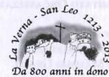
Santuario della Verna