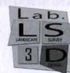
Laboratorio congiunto Landscape, Survey & Design